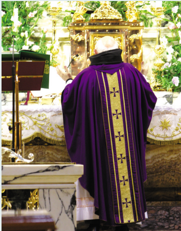
義大利教堂內神職紫色服飾