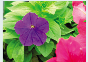
三色堇的紫青色花朵