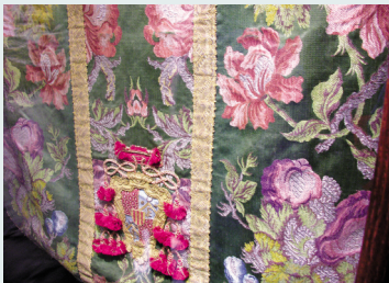
樞機主教的紫色法衣

上著名的皇帝，儘管政治上有著不可忽視的成就，但也是追求空幻的長壽與神仙之道皇帝典範。種種的規矩，在方士的推波之下，想像力被擴大，希冀神仙的見面與成仙羽化的機會。紫色就是神仙思想下的最佳對應色彩，皇帝住的宮闈叫做紫金城、辦公的地方叫做紫宸殿、出入的門叫做紫宸門。皇家的命運要看是否有紫氣，紫氣是祥瑞的象徵。命運更要看現今的小熊座，位於北斗的東北方，共有十五個星，以北極星為首，又稱之為紫微宮、紫宮、紫微垣，星辰的明亮與色彩變化均需向皇帝妥善報告，並解釋其意義、預知未來，可以說紫色就是皇帝的未來遭遇、命運，紫色的社會象徵地位也因此被推向了極至。