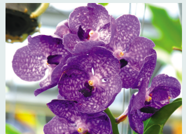
青紫色蘭花