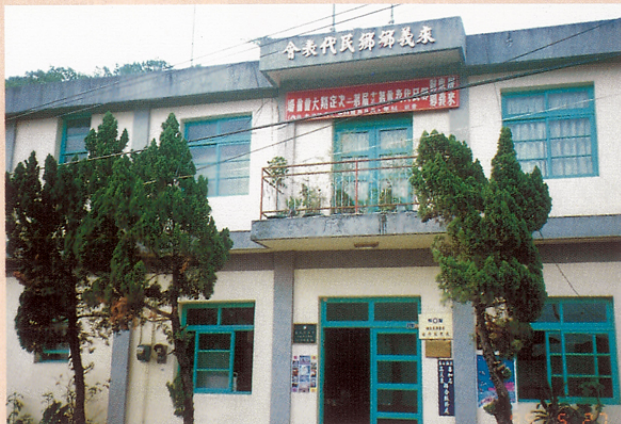
圖七 來義鄉民代表會。