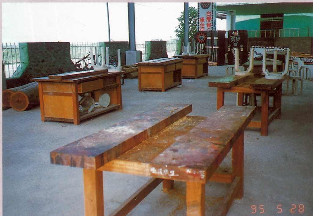
圖二八 來義國中的雕刻班教室。