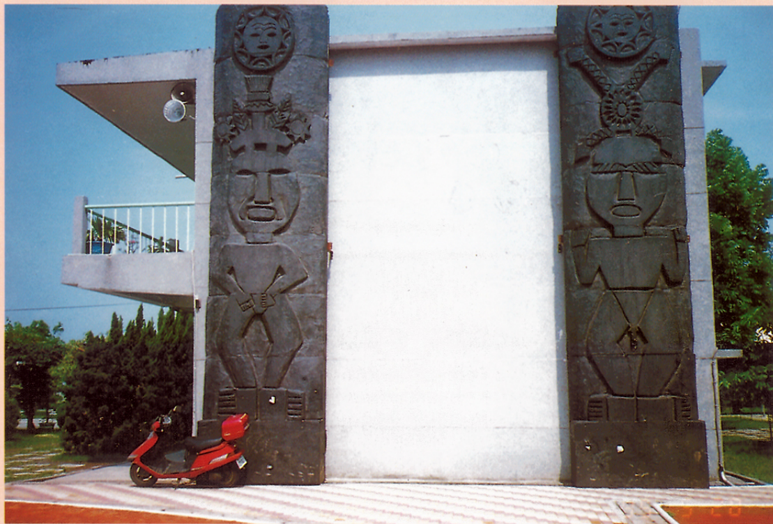
圖三十 來義國中的學生雕刻作品之二。