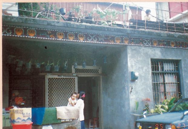
圖九 排灣族住家門板刻有傳統民俗藝術紋樣之二。