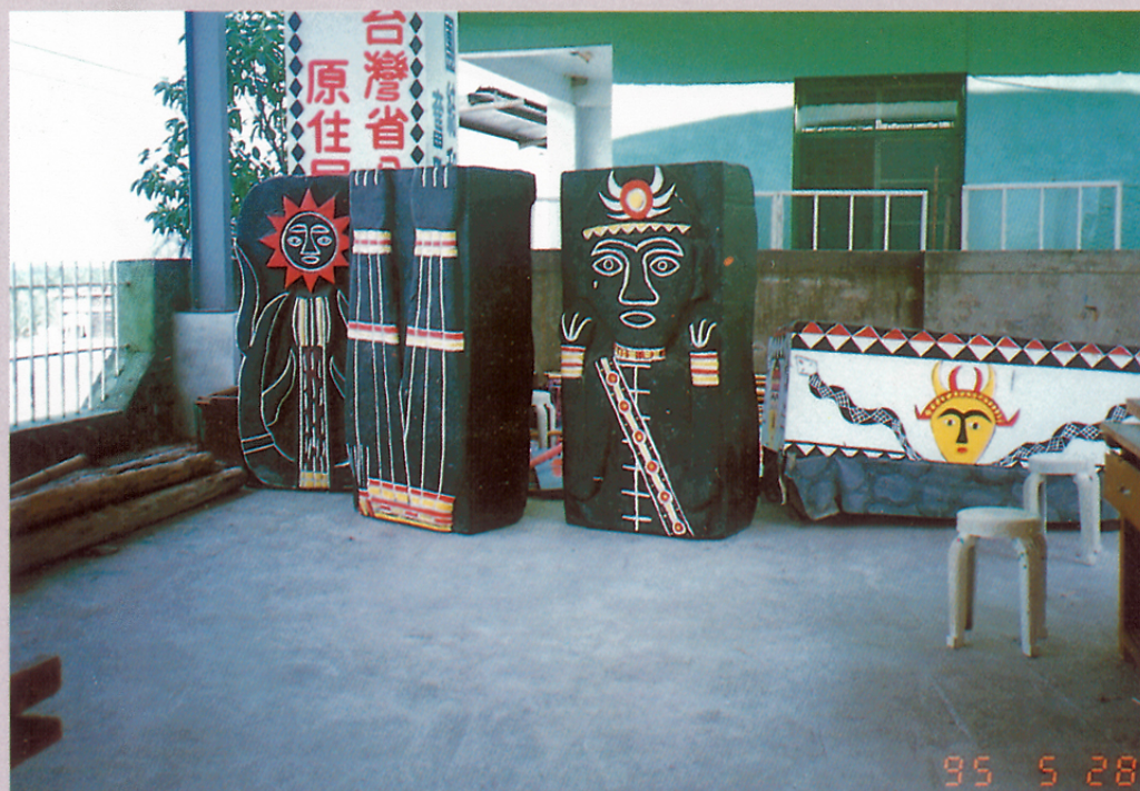
圖二九 來義國中的學生雕刻作品之一。