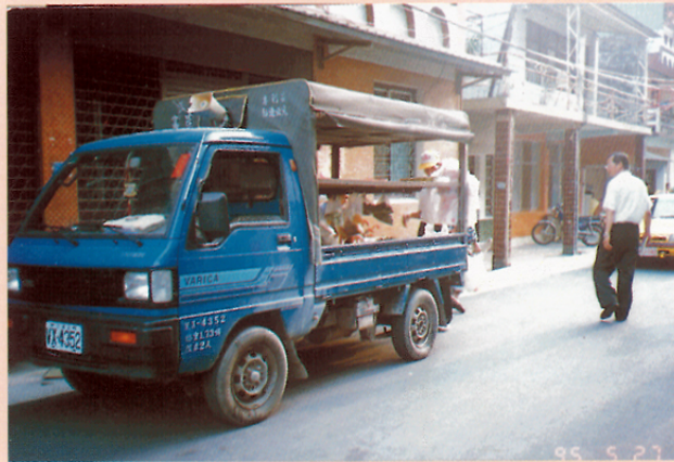
圖四 在古樓村中正路上沿街叫賣的活動攤販。