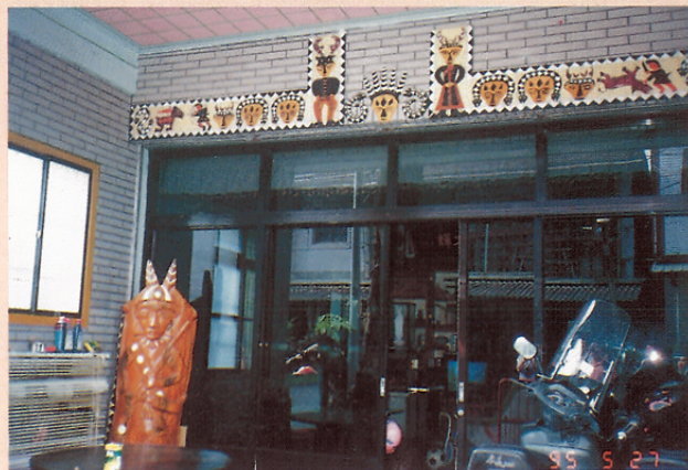
圖十 排灣族住家門板之三。

其中一個。雖然她從小就有神珠，但當時日本統治者禁止原住民行巫，所以直到光復後她才真正當起巫師。與我們晤談時，她是打赤腳，穿著深藍色綴有白點和紋路的普通便服。據她推算，從事巫師已有三十多年，因為她已主祭過六次「五年祭」。按照她的說法，巫師在祭典時，不能吃白米飯，不能喝酒，祭祀前不能吃生薑。在平日，巫師不到田裏工作，而以服務族人為職，服務的項目以治病為主。當兵、出遠門或就業祈福為次，根據她的說