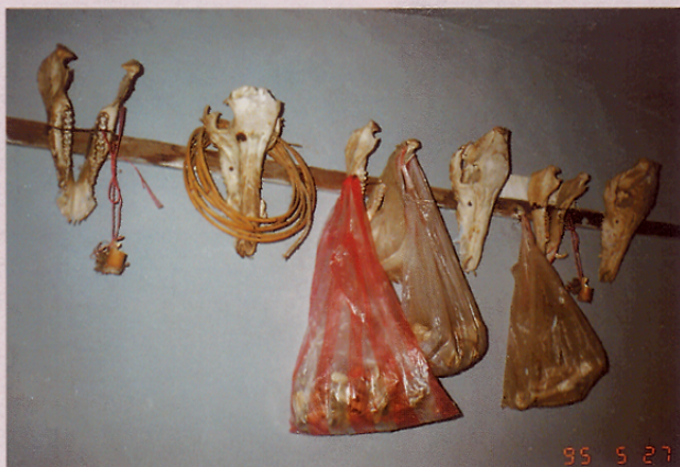
圖十四 祖靈廟左牆上掛有五具豬骨頭。