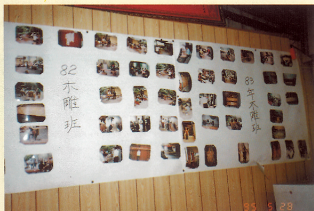
圖二一 原住民傳統木刻班訓練活動照片輯。

生活器具，包括陶針、木碗、湯匙、糕瓢、麻繩、整速輪、剝碎棒、固定架、打磨碎棒、壺、梭板、篩杯、篩子、竹碗、弓箭、隔間板、鐵鍋、青銅刀板、竹桶、竹梳、檐、斧頭、鋸子、竹藍、腰竹藍、粟米鏗、墊子、鐵耙、木輪、網袋、防熱墊、刀、刀鞘、單杯、連杯、螺旋、鑽、踩高翹、噴水器、竹槍、神球、竹杯、頭螺、鑽洞器、柱樑、骨飾、刨絲器等。(圖二三)