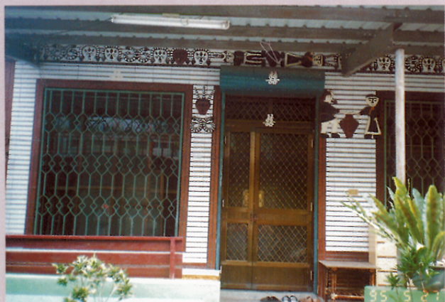
圖十一 排灣族住家門板之四。