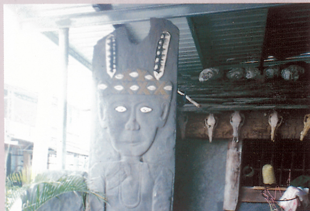
圖十八 羅木蘭頭目府上的石板祖先像。

個向西走，尋找適當的住所，他先到屏和，再到佳屏、佳興，最後到來義古樓，他每到一個地方，便立下一塊石碑，表示「創始地」，他一共找到了八塊土地，立了八個創造地，即今西排灣人八個部落。