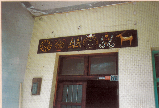
圖八 排灣族住家門板刻有傳統民俗藝術紋樣之一。