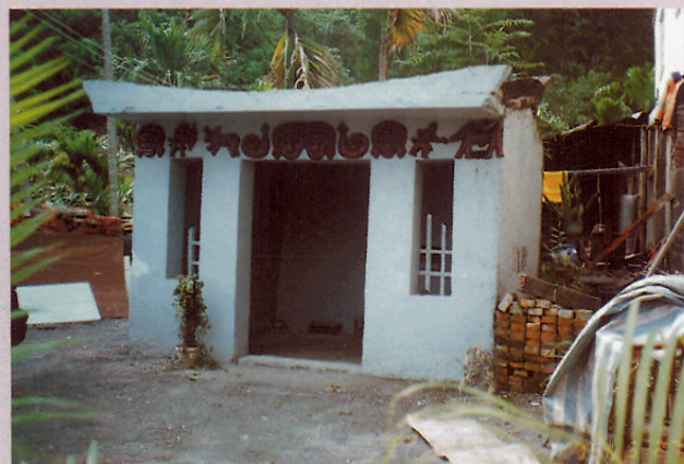
圖十三 古樓村的祖靈廟。