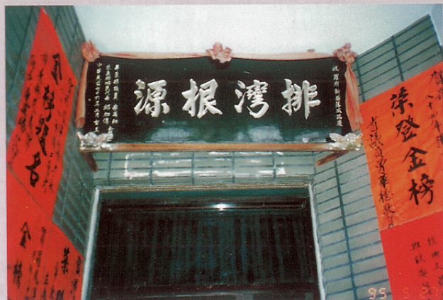
圖十六 羅木蘭頭目家屋的橫匾「排灣根源」。