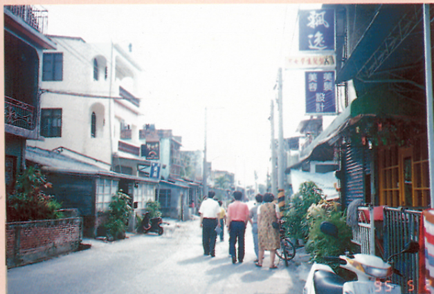
圖三 古樓村的街景（中正路）。