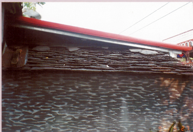
圖十二 排灣族石板屋。