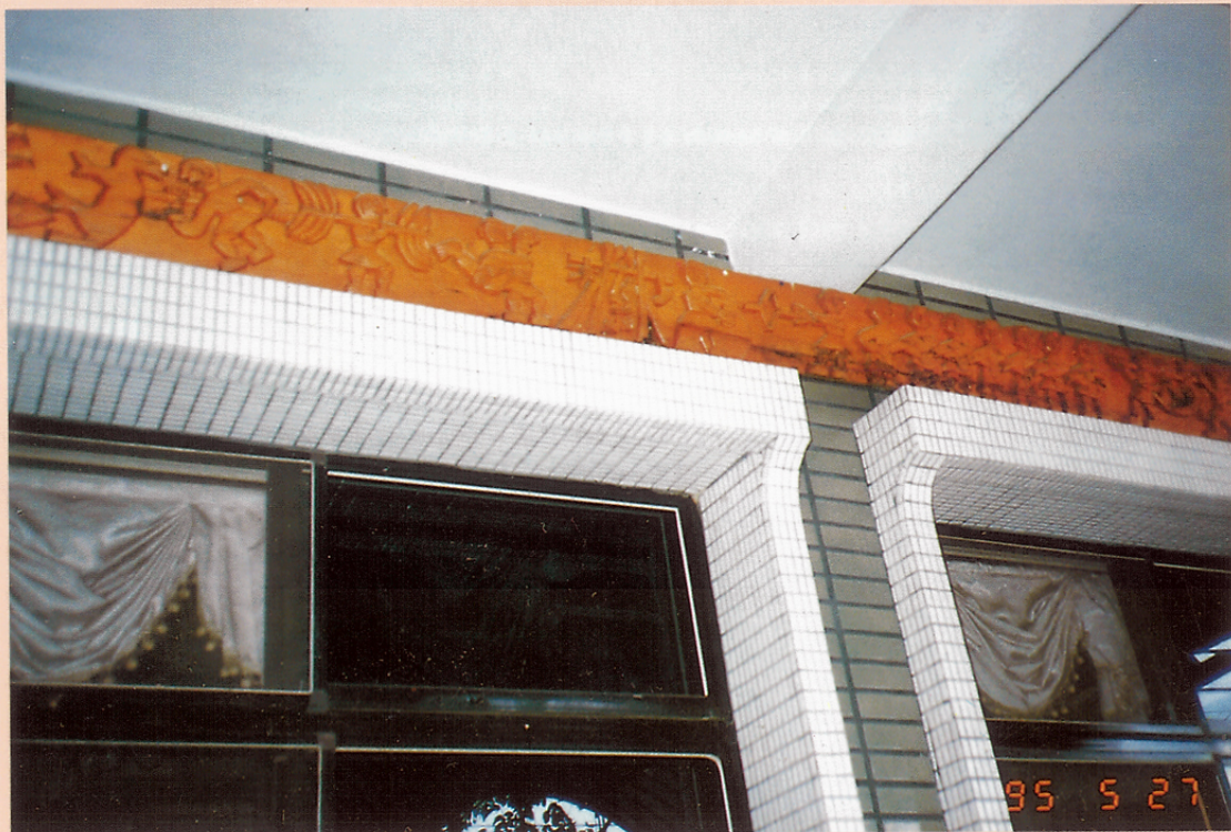
圖三一 來義國中的學生雕刻作品之三。

應清楚，否則會自陷於意識型態之爭的兩難處境，多元文化間是互尊互容互賞的，自然交流與演變，刻意的築牆對立，唯恐是製造文化衝突問題，而非解決問題。