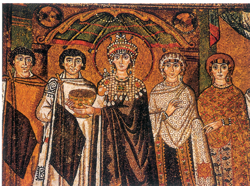
塞奧多拉皇后與侍從 馬賽克嵌畫 約 547 A.D.

形式美的價值，在藝術上，在自然物中，並不是完全一致，能夠改變，加增，減少，甚至還有時可以說否定了美。這種情形的構成，則是在於形式的知合或反對特殊的完美，目的或作用，如果是和合的越完美，其美的程度自然增加，如果是站在反對方面，則也是依照其程度的高低，而減少或消失其形式