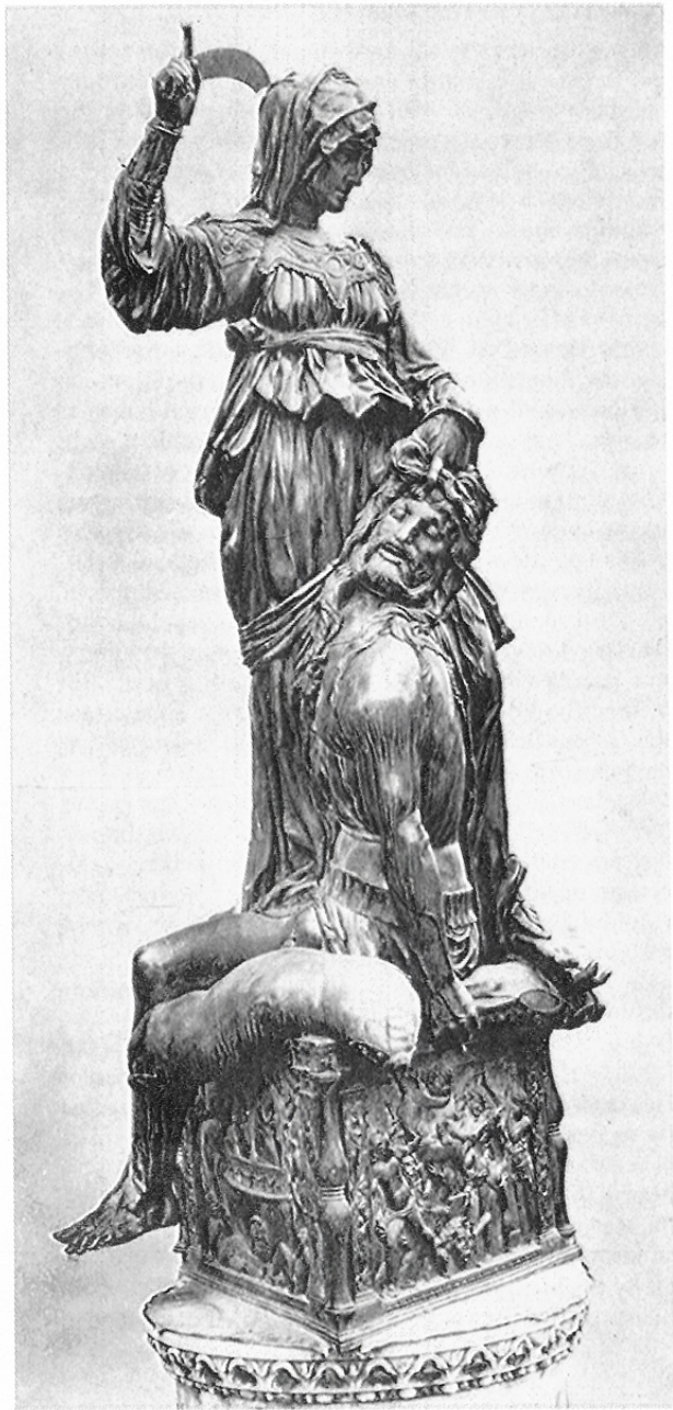
唐那太羅 榮蒂斯與荷羅費那 1456年 青銅 7'9" 佛羅倫斯

品，具有它本類的完美，或者具有應該有的目的出現，也發生著它該發生的作用；我們就說它是美的，並且也可以與事物和形式的真理，共同存在，這時候，美與真就可以相等而互換了，然而如果這個事物，內在的不與自己的形式或目的相呼應，那它就不是真理，而有真理的缺失了。這個與基本然和作用相呼應的真理或相合，在藝術上，它的形式，應該與自己要表現客觀內容，完全凝合在一起，而也真的在一起，這時的藝術就有著普遍的重要性了。如果沒有這種呼應或相合，藝術也沒有什麼價值了。那末，您目的與作用中，要看出美的存在，對於這種呼應是應該深切注意的。