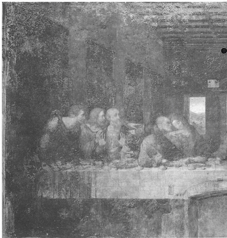
雷奧那多·達文西 最後晚餐 約 1495-97/98 年 壁畫 米蘭

作用，機能，實用，對一個物品或機械可給予它美的評高低或有無，也就是說它美或不美；並不在於它的形式醜惡粗糙，結構與工作能力強大快速，俐落就好了？比如