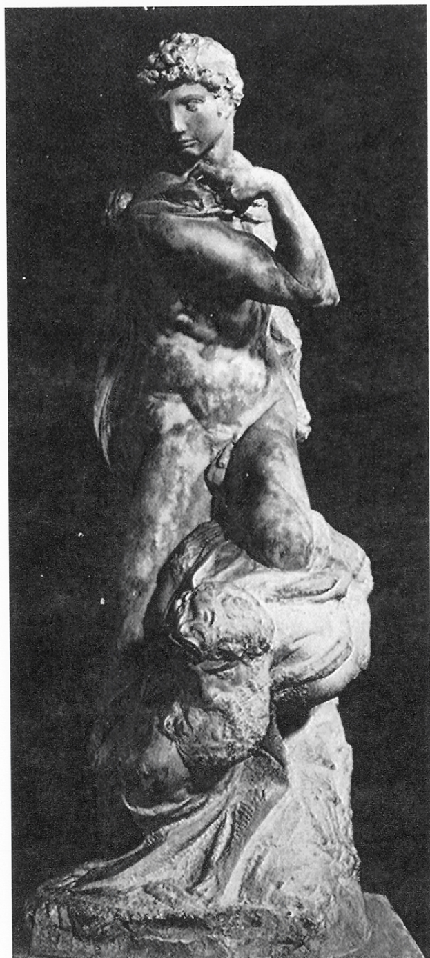
米開朗基羅 勝利 1527-28年 大理石 Vecchio廣場 佛羅倫斯