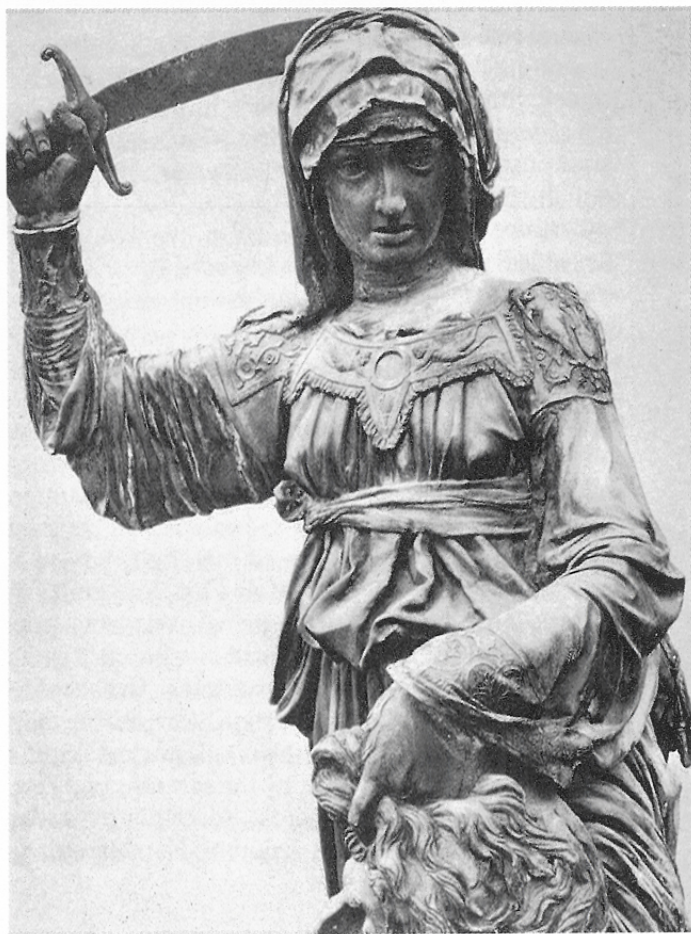
唐那太羅 萊蒂斯與荷羅費那（局部）

由形物表達出來的美與純形式的美，是有所分歧的，人面桃花、白裡透紅、和諧均衡、容光煥發的美麗，與那從這種表現而映出的心靈美，是不一樣的，同樣的形象姿態，也能透露出心靈的醜惡，一張在本體說是美麗的面孔，然而由於缺乏表情，縱然面孔還具有和諧均稱，美的價值也很自然的丟失了一部分；如果再具有一種癡呆的表情，那形式的美，自然就滑落不見；並且還會由於喧囂嘈雜，不但美不見了，並且還變成了醜惡，而有了否定的價值，反之，有時候，人的面孔，由於粗魯的線條；本來是不調和的呈現著，可是由於它的表情，非常莊重嚴正、威儀凜凜、一絲不苟，反而映像出智慧、德行、意志的毅力、心懷的坦誠、發著美麗的光輝。不但只是面孔如此，也不但只是人類如此，其他動植飛潛，也有這種的境界；蒼松翠柏、柳綠花紅、秋山楓葉、老圃黃花、斷橋流水、原野寒鴉、虎嘯獅吼，馬嘶鹿鳴、都能由於表態各異，而