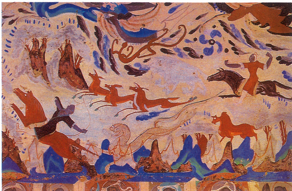
敦煌 莫高窟 249 窟 狩獵 壁畫

然而，我們對於理想美，也該想到或注意到：屬於它專類的完美等級與條件，是應該指定的，可是對於某一個理想的探認，是沒有多大用途的，（無論是在藝術作品上，在自然物中，在自然世界中，在思