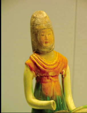
唐三彩的黃