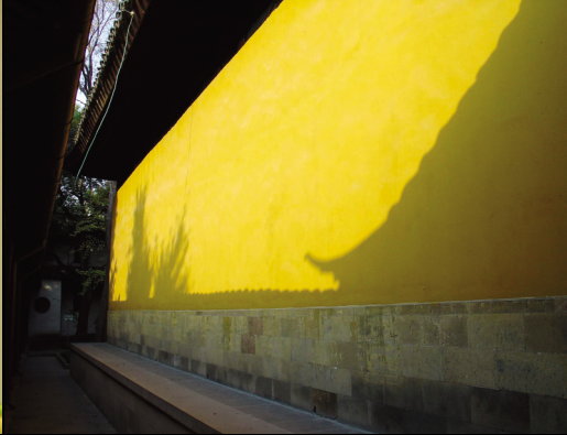
蘇州寒山寺的黃色牆壁

有血色的臘黃或死黃之色彩變化更為明顯，因此「氣色很好」成為見面的健康問候語。台語中，另有「黃酸」的說法，用以形容不健康的色彩變化兼帶有損人意味，如「黃酸仔」。