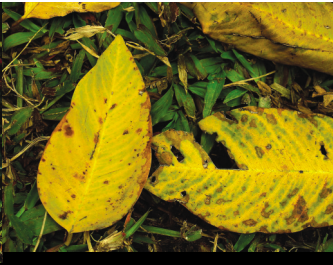
黃色的落葉