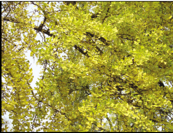
秋天銀杏葉的黃