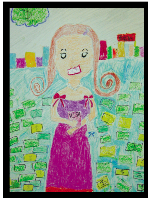
圖6 拜金女「蒙娜麗莎」— 有美麗外表又多金的拜金女

行商品上，廣為流傳。她的圖像並被許多藝術家加以挪用、改造，製作成各式各樣之「蒙娜麗莎」，對於她謎樣微笑背後秘密的探尋可謂從不間斷。本單元使用數張影像合成之「蒙娜麗莎」圖像與達文西原作為鑑賞教材，並以觀察、分析、詮釋、判斷等步驟進行，鑑賞教學活動內容設計如附錄1。影像合成後的「蒙娜麗莎」分別化為美女身上的泳裝圖案、廣告模特兒、黑人美女、卡通小豬造型等（因版權問題，本文未附原圖）。本單元除介紹達文西原作，欲藉古典原作變身後之視覺文化圖像（合成作品）與原作比較，引導學生了解後現代影像合成創作手法及其圖像意涵，並以女性主義角度詮釋探討圖像中呈現女性角色及形象之變化與刻板印象，藉此達成價值澄清的目標，導入其後續創作中。