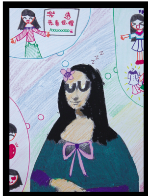
圖5 作夢的「蒙娜麗莎」— 屬於女生的夢想世界