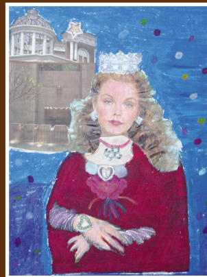
圖3 王妃「蒙娜麗莎」— 高貴美麗的「蒙娜麗莎」最適合搭配城堡了

藝術作品及視覺圖像詮釋方法。此不僅在於思考與觀看藝術方式的改變，亦為視覺文化對藝術創作之影響所致。藝術家的創作中包含當代視覺文化圖像，表達的議題隱藏著作者之文化背景、區域性特色、種族、性別、社會、經濟等複雜的層面，表現手法與媒材亦深受科技影響，二者皆使圖像解讀趨於多元，因而進行鑑賞教學時宜根據作品或視覺圖像作多角度之理論分析，以利學生練習以多面向的方式觀察與判斷，並進行反思。