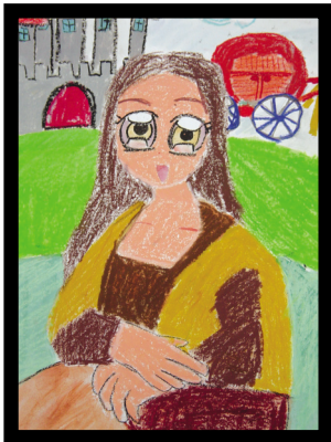
圖4 灰姑娘的「蒙娜麗莎」— 如灰姑娘般美麗的「蒙娜麗莎」