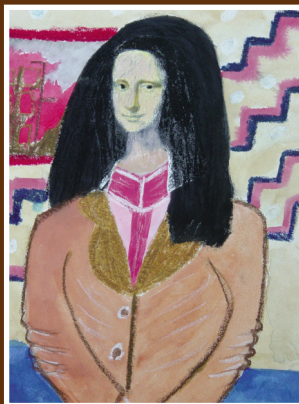
圖2 主播「蒙娜麗莎」— 「蒙娜麗莎」的微笑像主播般親切的笑容