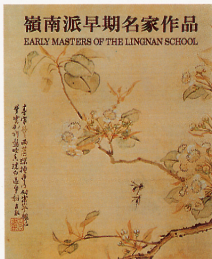
嶺南派畫風，對香港早期的國畫發展有很大的影響。圖為香港市政局主辦在大會堂高座，香港藝術館展出的場刊封面1-4-83至8-5-83。

教育之觀念」一文，收錄在教育署美工中心出版的《美術教育一九九四》，香港印務局，1995。