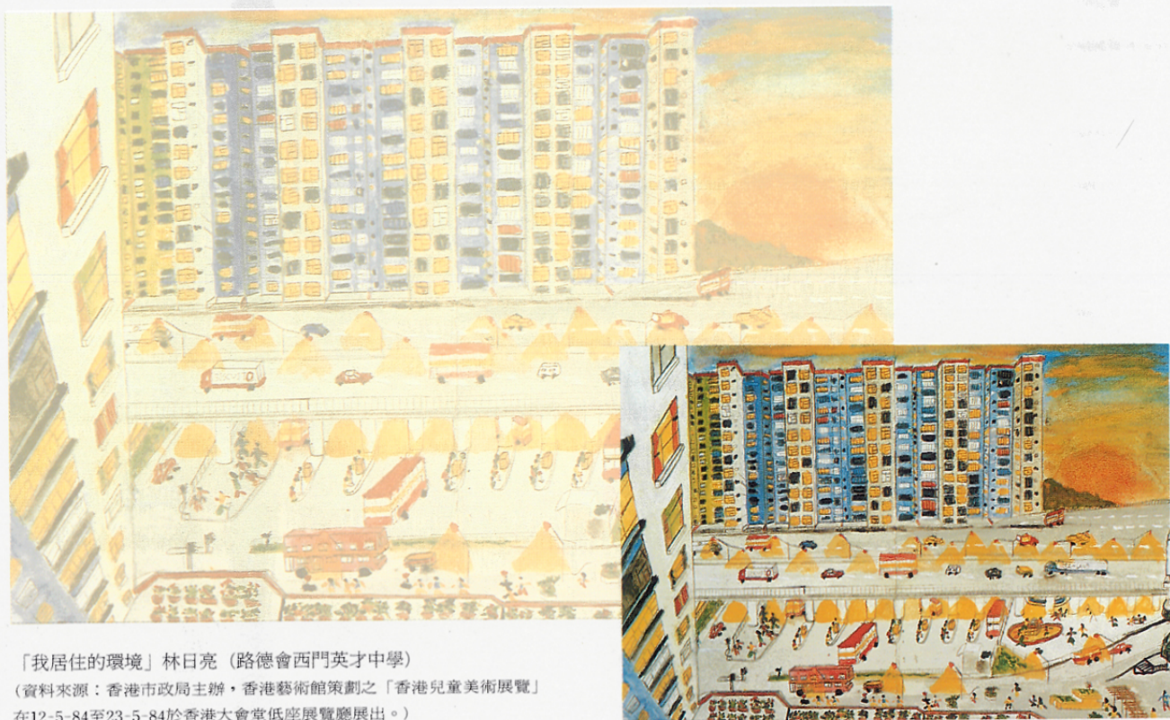
「我居住的環境」林日亮（路德會西門英才中學） （資料來源：香港市政局主辦，香港藝術館策劃之「香港兒童美術展覽」 在12-5-84至23-5-84於香港大會堂低座展覽廳展出。）