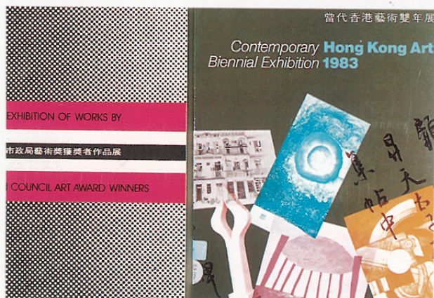
香港「市政局藝術獎」始創於一九七五年，由香港藝術館策劃，目的在獎勵有前途的藝術家，後改為「當代香港藝術」雙年展。