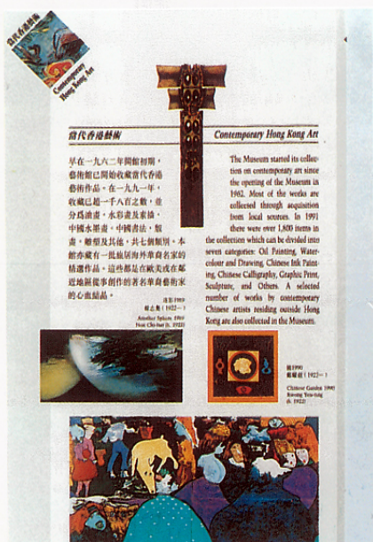
於一九九一年開幕的新「香港藝術館」，有一個「當代香港藝術展覽廳」，這是簡介小冊中的一頁。