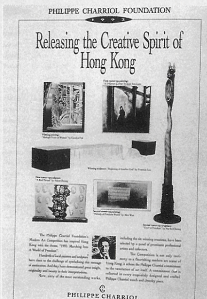
由夏利豪公司贊助的藝術創作比賽。

時使用率却偏低，特別是小學。原因是沒有針對本身所選教材去搜集，大都是依畫種一堆一堆的保留，貯存欠缺系統性。試問有誰願意攬抱大堆教具到課室上課？一個未受美術專業訓練的教師又如何懂得那一張圖畫可以介紹構圖原理？在一大堆資料中，去挑選一兩張參考資料也是很花時間，所以許多時教師寧願空手上課，用口才隨意演繹教材內容便算。