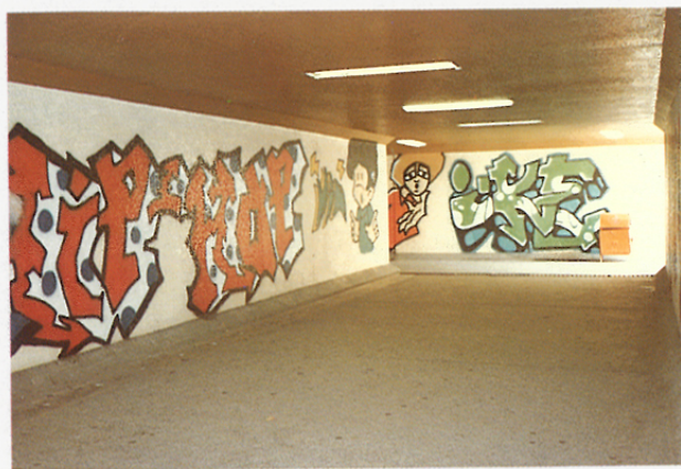
在市區隧道出現的街頭噴畫