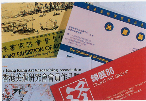
各種藝術團體的展覽活動