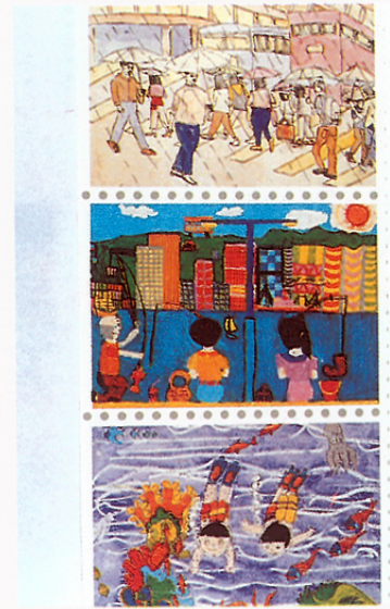
小四至小六獲獎作品