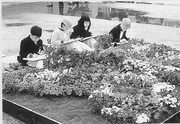
一九九五年在沙田公園舉行的花卉展覽，同時舉辦「學生花卉繪畫比賽」寫生活動。

學校和教師，有否配合時代改革，去為學生提供符合時代需要的教學內容③。因為現時香港學校的美術教育，沒有教科書監控，沒有具體評核方式的約束，沒有明確的進度要求，自由度較鄰近地區都非常大。就個人所見，大多數學校仍視美術教學是一種消閒活動，以為隨便塗塗貼貼，就是讓學生發揮自由創作的最好設計。