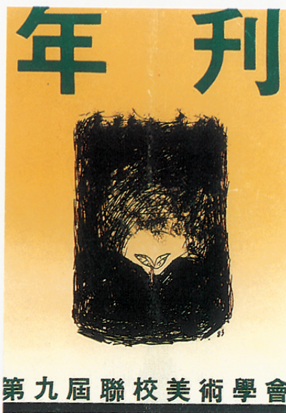
聯校美術學會是香港唯一的中學美術學會的聯合組織，間中有舉行教學講座和學生作品展覽。