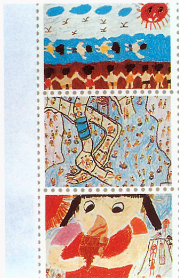
小一至小三獲獎作品