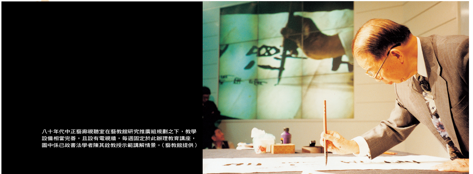
八十年代中正藝廊視聽室在藝教館研究推廣組規劃之下，教學設備相當完善，且設有電視牆，每週固定於此辦理教育講座，圖中係已故書法學者陳其銓教授示範講解情景。