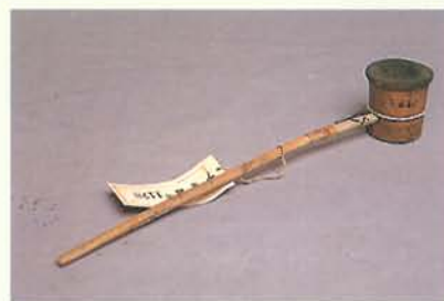
泰雅族的竹製煙斗