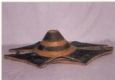
雅美族的木雕女帽

南部諸族的雕刻，在性質與北、中部不同，是屬於象徵的，乃至寫實的雕刻藝術。雕刻的種類有凹刻、浮雕、透雕與立體雕刻等，而雕刻的器物的範圍也甚繁多，尤以排灣族為最盛，其器物種類有築物、傢俱、用具、武器、宗教器物以及玩賞雕物等等，刻雕物以材料來分，以木雕為主，兼及石雕、骨雕、竹雕、貝雕和角雕等等。排灣族的雕刻器物最多，其代表雕刻為門楣、木桶、祖先柱的浮雕、飲食器具、飾物用具的透雕或立體雕刻，如連杯、煙管以及祖先像與木偶等為全雕。最常見的雕像是人首與雙蛇，其次為裸身人像、動物及繩紋、菱紋等。