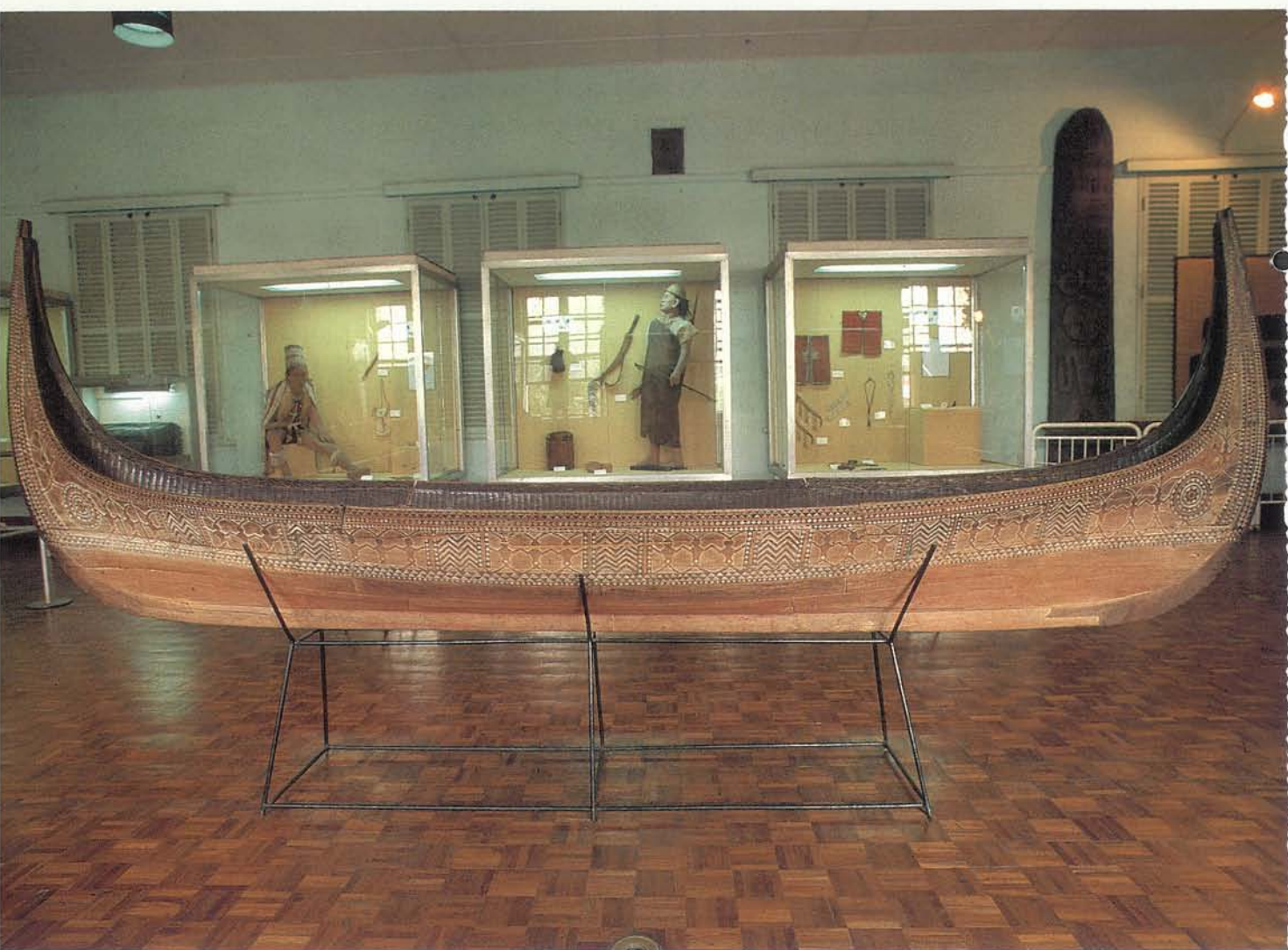
雅美族的舟——博物館中的陳列品