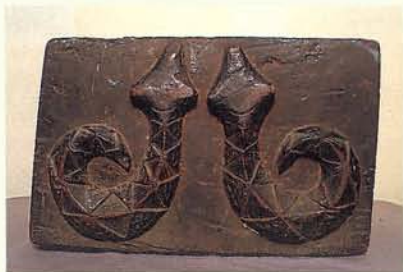
排灣族的雙蛇木雕

高山各族中，北部與中部的泰雅、賽夏、布農、曹等族對雕刻較不重視，只有若干線刻與凹刻，僅在裝飾物、樂器、武器與煙管上刻以若干幾何圖紋。在南部各族如排灣、魯凱、卑南及雅美等族，都有浮雕及立體雕刻，尤其排灣的雕刻藝術已有高度的發展。