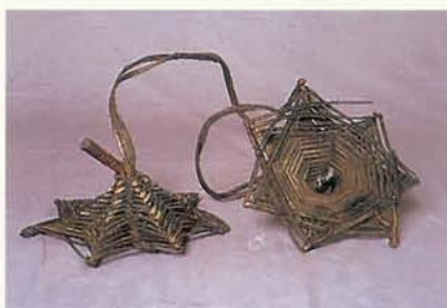
布農族的端錫用的編器