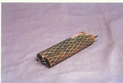
泰雅族的竹雕耳飾