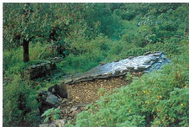
好茶魯凱族的石板屋