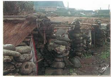
雅美族的船屋——存放魚船