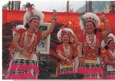
阿美族婦女歌舞——在現代的婚禮