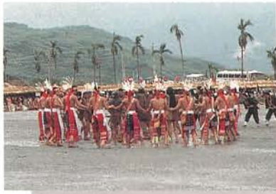
阿美族同一年齡階級花豐年祭共舞