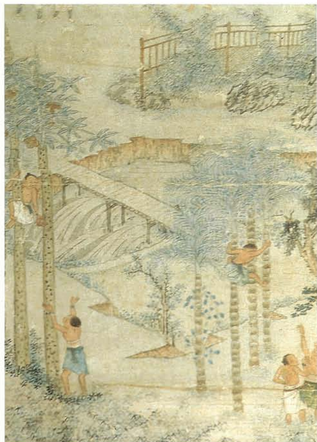
清代番俗圖中的平埔族摘檳榔