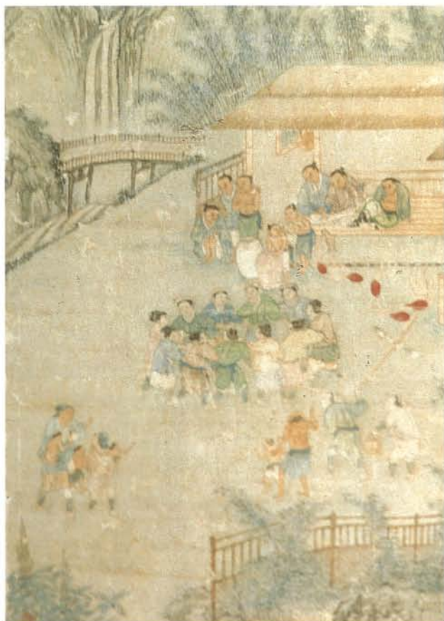
清代番俗圖中的平埔族歡宴