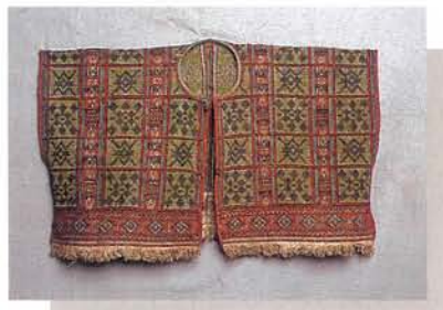
平埔族 (巴宰海) 的男上衣