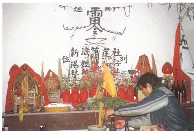
現代台南麻豆西來雅族的祭壇