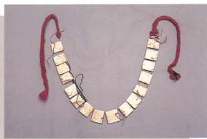
曹族的臂飾——野豬牙