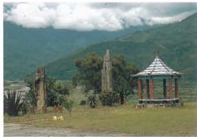
舞鶴的立石——史前遺址