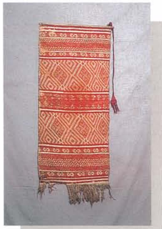
平埔族 (巴宰海) 的旗幟