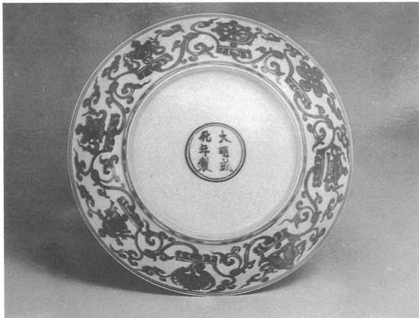
成化纏枝蓮托八吉祥紋盤