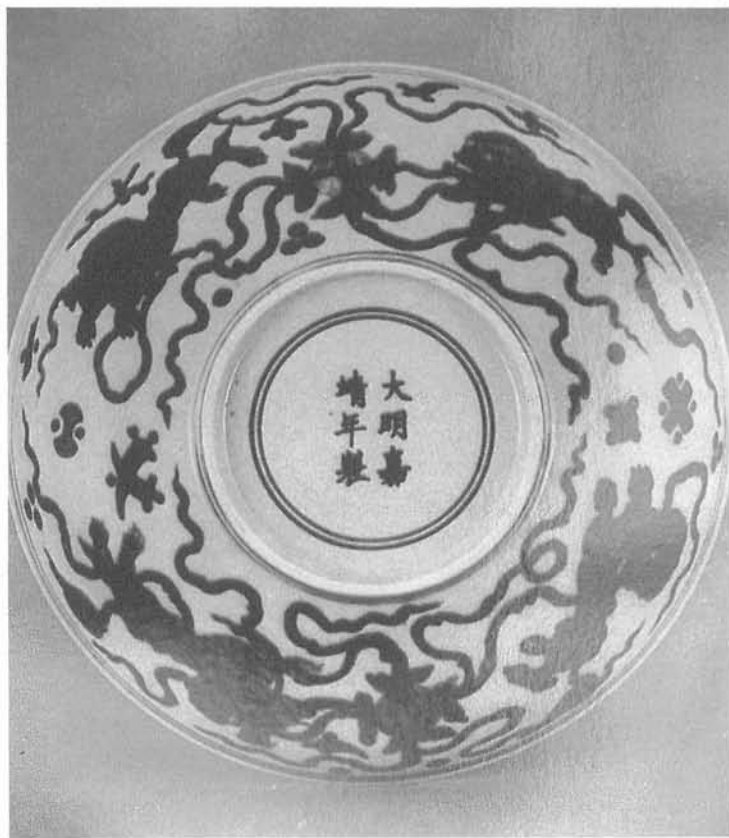
嘉靖官窯上的雜寶紋飾

另外一方面，從八吉祥排列順序的角度來看（附圖一，註四），從元到明大致可以分成三個階段，第一個階段是元代，屬於無規則的排列，八吉祥文在瓷器上的裝飾，並沒有一定的順序，而由印花的工匠隨意組合。第二個階段是從明永樂到嘉靖時期，這時候的八吉祥紋飾出現了穩定的組合順序，常見的為輪、螺、幢、傘、花、魚、瓶、結的形式，多按逆時針方向排列，明代成化時期將輪繪在盤心，器壁繪螺、幢、傘、花、魚、瓶、結的，這是個較特殊的例子，一般而言，組合的順序是固定且嚴格的。