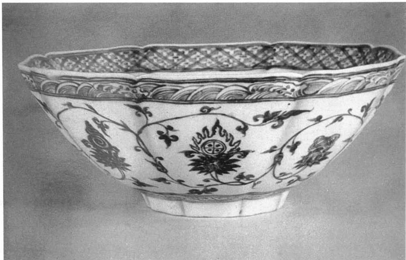
宣德官窯上具備了完整的八吉祥紋