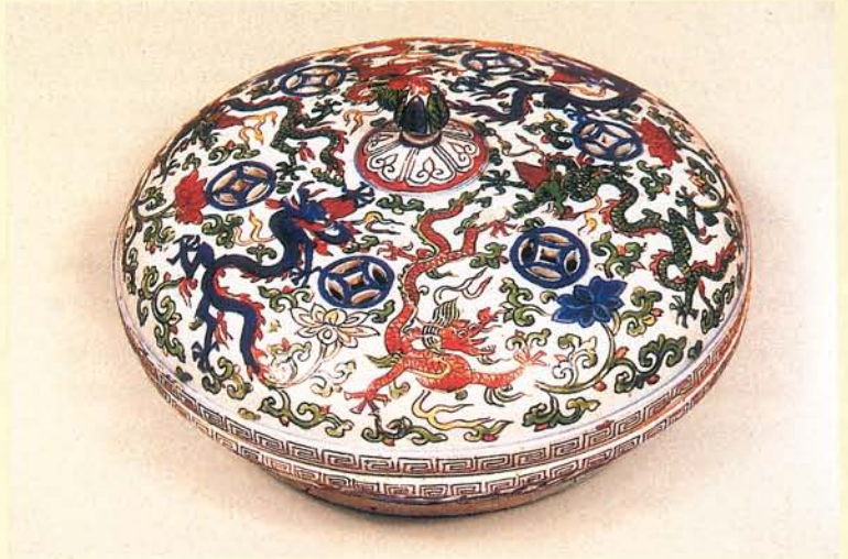
明晚期龍紋雖然色彩豔麗，但在畫工和意匠上大不如早期。

藍為主要顏色，而龍紋隨著色彩更有著某種規律的變化，在我們鑑別萬曆五彩龍紋頗有助益：