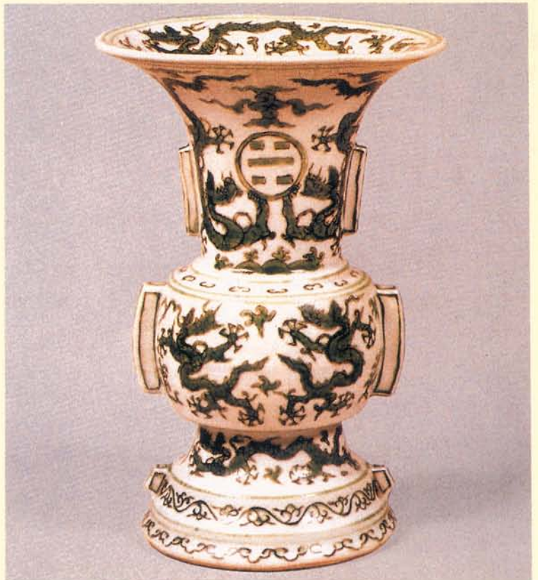
萬曆時期的龍紋，已有向清代過渡的特徵。

就龍紋造形而言，雙眼的排列有三種：併排、正面、一上一下，併排是明中期所常用，而正面和一上一下則為明晚期常用，而逐漸成為清代龍紋的標準樣式，髮皆成一束往上或往後飄舉，鼻鬚亦往上或往前飄舉，眉的部份有的不畫或呈M形，鱗片常以網狀式的線條來表現，爪子大都為五爪，少部份為四爪，但數量極少。