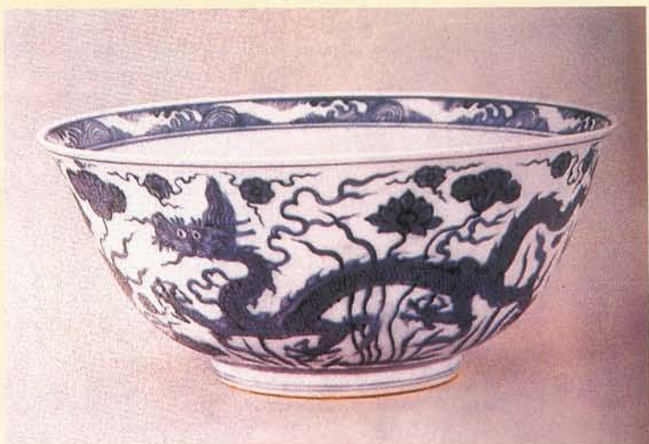
蓮池遊龍紋飾是弘治朝一大特色。

弘治朝有雲龍紋、穿花龍以及海水龍紋三種，其中最著名的蓮塘遊龍，應該淵源於宣德時期的穿花龍紋，另外值得一提的是在弘治時期相當盛行的雙龍搶珠紋飾，大部繪於盤心或碗心，以雙龍頭尾相銜接而龍首居中搶珠的圓形構圖，造成一種流動活潑的視覺美感，是弘治朝相當別出心裁的龍紋裝飾。