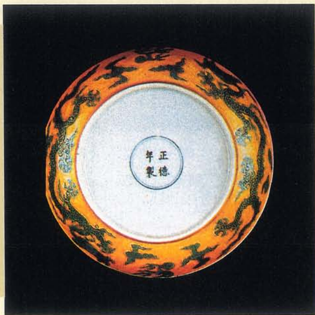
橫向行龍紋是明中期最常見的紋飾之一。

明中期： 明中期從成化開始歷經弘治、正德兩朝，此時期的龍紋有著明顯的改變，元及早期所顯示的那種矯健，威猛的神態不見了，而像是被豢養的深宮寵物，溫馴而無野性，永樂、宣德時期對龍紋採取寫實的方式，筆力生動而合乎生理結構，並以深淺不同的渲染，表現出立體的動感，成化以後雖然承襲早期的形態，但是由於局部描繪欠妥，而使得龍紋變得刻板沒有生氣，如側面龍頭以一雙平行