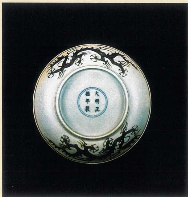
輪形爪和刻劃鱗片的手法是明中期龍紋的特色。

弘治朝的龍紋基本上和成化朝差異不大，但在紋飾的處理上則有逐漸簡化的趨向，以龍紋的造形而言，計有四種變化，從構圖來說，