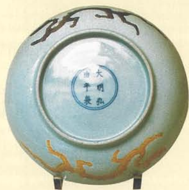
明中期在龍紋的氣勢和畫工技巧上，遠不如早期精彩。