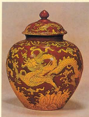
明晚期的龍紋，以色彩變化豐富見長。

剪影般的鉤狀，在明早期常用向上勁揚的鬚狀眉毛，經過明中期末簡化成 \sphericalangle 形，在明晚期更是被大量採用，一般來說，明晚期的龍紋大都下筆草率，構圖圖案化，喜歡以雙龍搶珠等構圖來表現，唯一令人一新耳目的只是在明晚期流行的五彩技法上，讓龍紋呈現了多種彩色的新風貌。