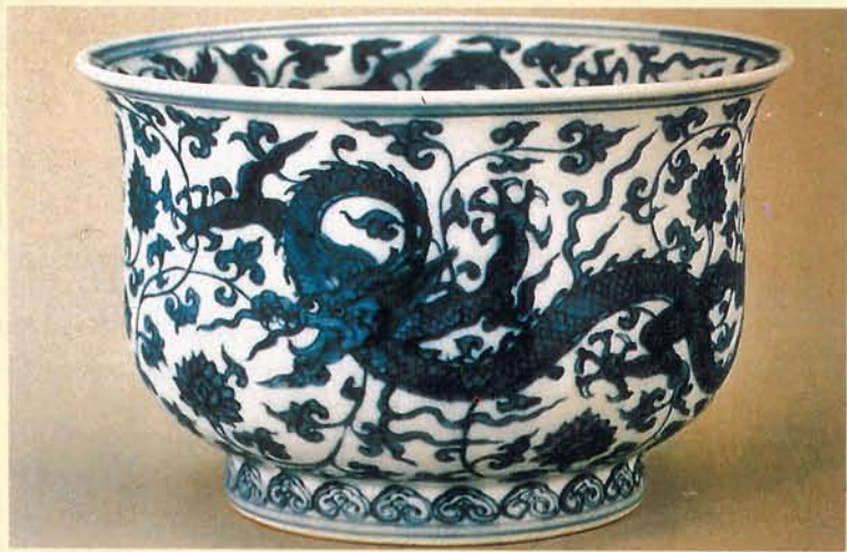
嘉靖時期的轉頸式龍紋，源自於宣德時期。