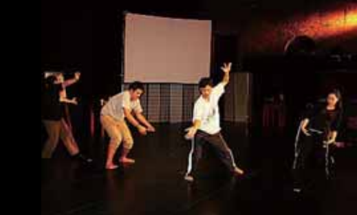
圖15 「扭動的樹」肢體練習。