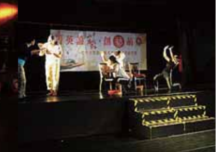
圖16 默劇「闖空門事件」排演情形。

編舞」，根據音樂融入情境，表演一段5分鐘有主題的節目。編舞概念需結合節奏、線條、空間、時間、音樂性、情境等元素，讓每位參與者都成為舞者與編舞者。