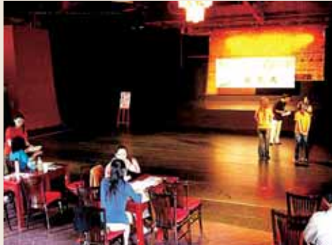
圖1 台北市西門紅樓劇場內部情形。