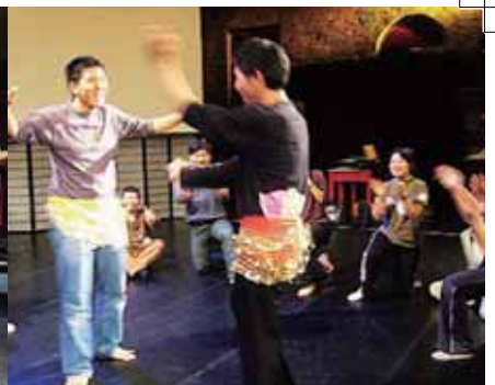
圖14 教師圍上鈴鐺絲巾表演土耳其舞情形。