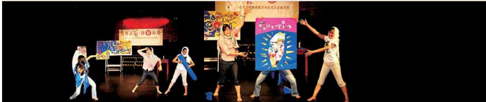
圖4 筆者小組以「創意台灣·無限發光」為主題，結合雲門舞集名作「薪傳」的概念演出情形。