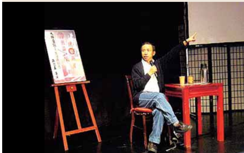
圖11 吳念真導演講課幽默風趣發人深省。