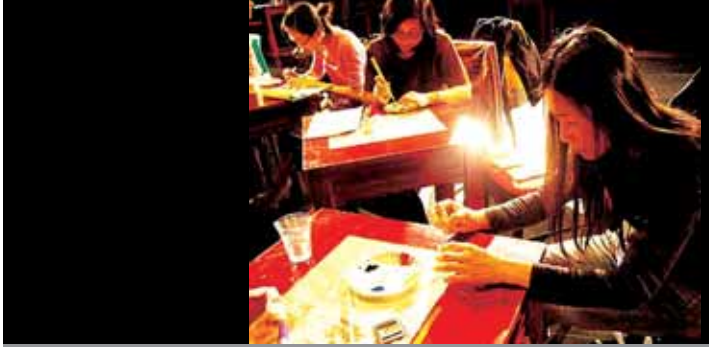
圖8 教師們聚精會神的彩繪幻燈片情形。