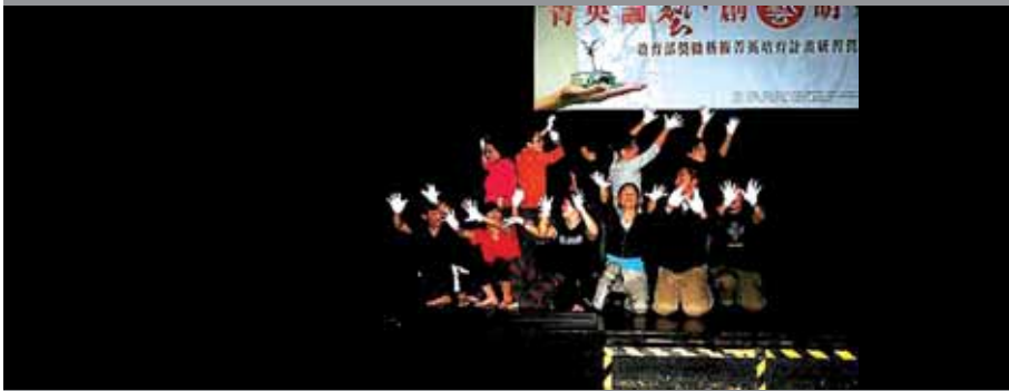
圖10 團隊表演「黑光劇」情形。