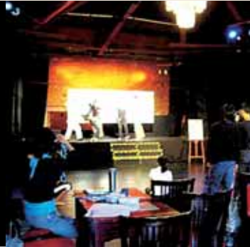
圖2 教師表演「加減乘除秀」情形。