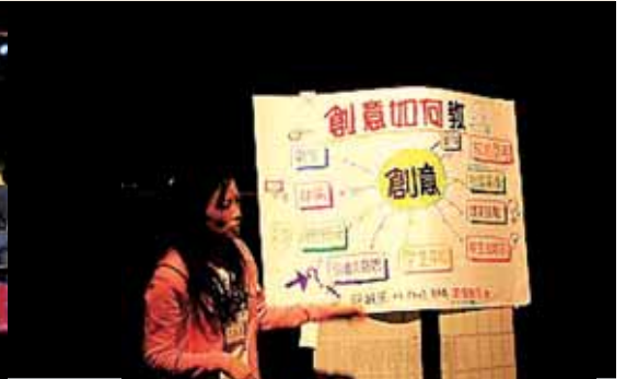
圖3 筆者說明「創意如何教」情形。