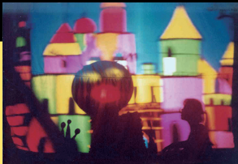
魔奇寶寶（由玻璃紙製造顏色效果，眼睛、嘴巴為手電筒的光）。