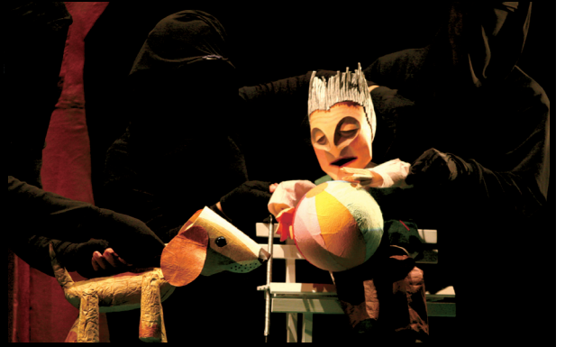
偶偶劇團《紙要和你在一起——老人與小皮球》演出