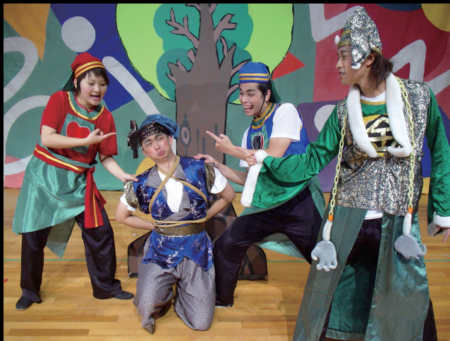
大開劇團《萊爾王》演出