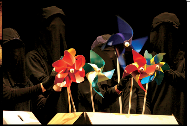
偶偶劇團《紙要和你在一起——小小紙風車》演出