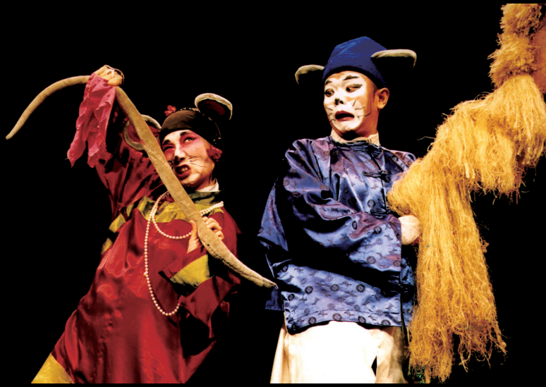
鞋子兒童劇團《老鼠娶親》演出