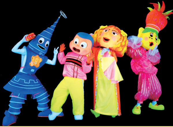
杯子劇團《黑光幻妙劇— 魔幻寶盒》演出（2004年度公演）