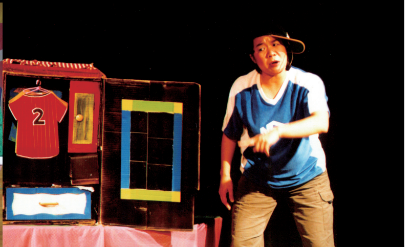
小袋鼠說故事劇團《妖怪怕怕》演出

當我們知道戲劇對兒童可以有的學習功能時，我們真心希望，不要讓我們的孩子演出是為了娛樂大人、滿足大人的虛榮心。尤其當帶戲劇課程的老師並不是很清楚戲劇的內涵是什麼？不了解創造性戲劇活動是什麼？不清楚教育劇場、參與劇場的差別時，老師應該要自己先多準備，不要拿孩子做實驗。