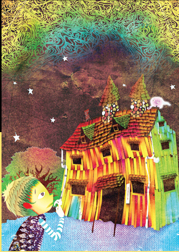
逗點創意劇團《膽小鬼》演出