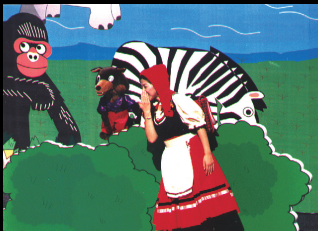
一元布偶劇團《小紅帽》演出