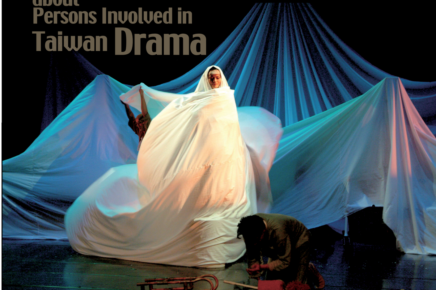
九歌兒童劇團《雪后與魔鏡》演出