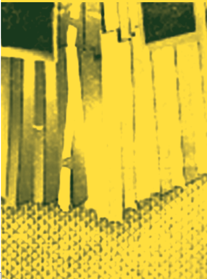
一元布偶劇團《小紅帽》演出

1969年成立兒童教育劇團，並且由兒童戲劇推行委員會舉辦兒童戲劇班，與北市教師導演人員訓練班，並有示範演出，並在每年舉辦的兒童戲劇訓練班演出中選出有戲劇天分與興趣的會員繼續排演，或參加電影電視演出。漸漸的有更多以兒童為演員的兒童劇產生，這和現在大部分由成人演給兒童看的兒童劇團大不相同，也因為當時的師資與基本的理念與精神尚未完備，所以，這種戲劇推動的方式對兒童發展之功能、影響備受質疑。但是可以肯定的是，當年一定培養出不少戲劇人。