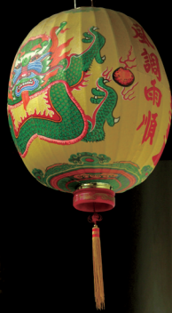
台南武廟綠色燈籠