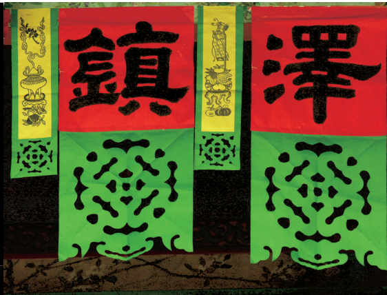
台南武廟大門綠色甲馬花飾