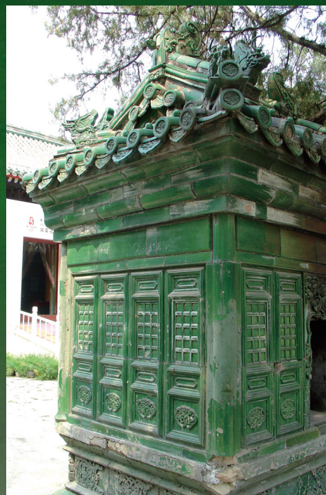
北京孔廟的綠色琉璃燎爐