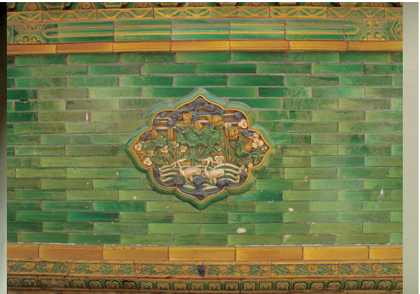
紫金城綠色琉璃照壁

彩，《增韻》解釋碧字「深青色也」，碧也指寶石，稱為碧的寶石有綠碧、有縹碧，唐代的官服八品、九品就是以碧色代青色。現代字典對碧字的解釋是鮮綠色的，如碧草如茵、碧玉、碧綠的用法，都用以表現綠色。