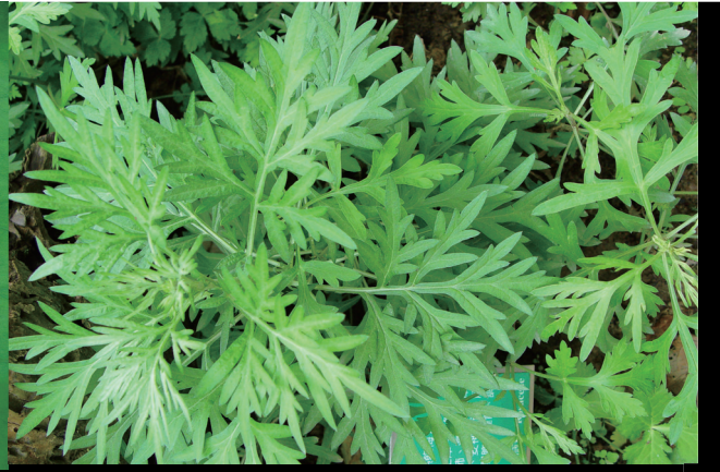
台灣菜包的綠色原料艾草