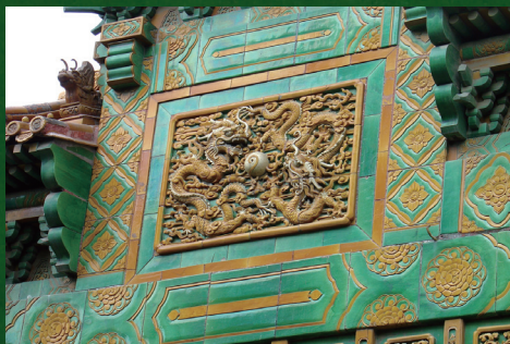
北京孔廟的牌坊綠色琉璃