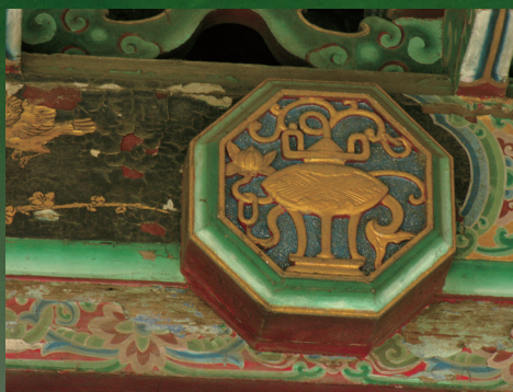
北港朝天宮門當綠色與其他色彩的搭配