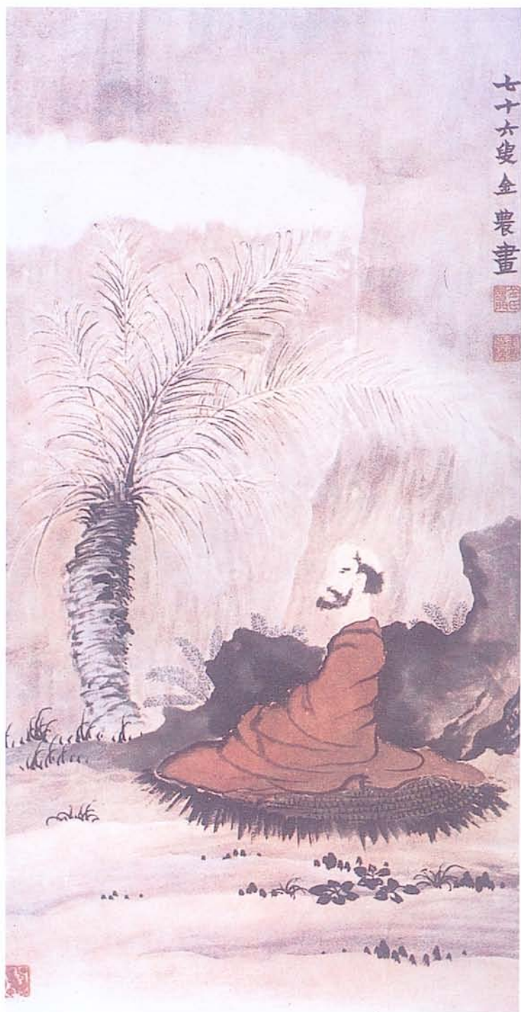
▲清 金農 《羅漢圖》(圖八)