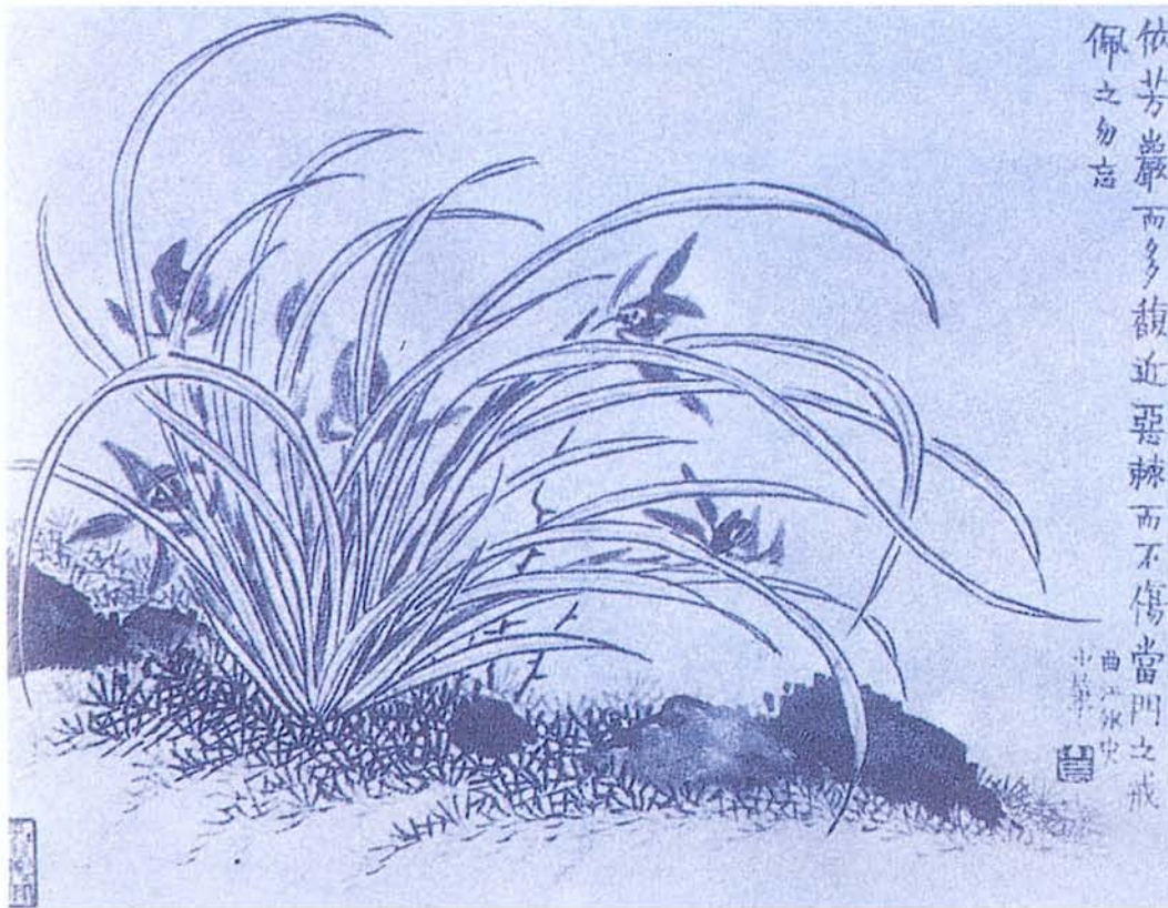
▲清 金農 《花卉圖之四——芳蘭》(圖五)