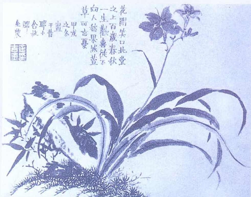
▶ 金農 《萱花》