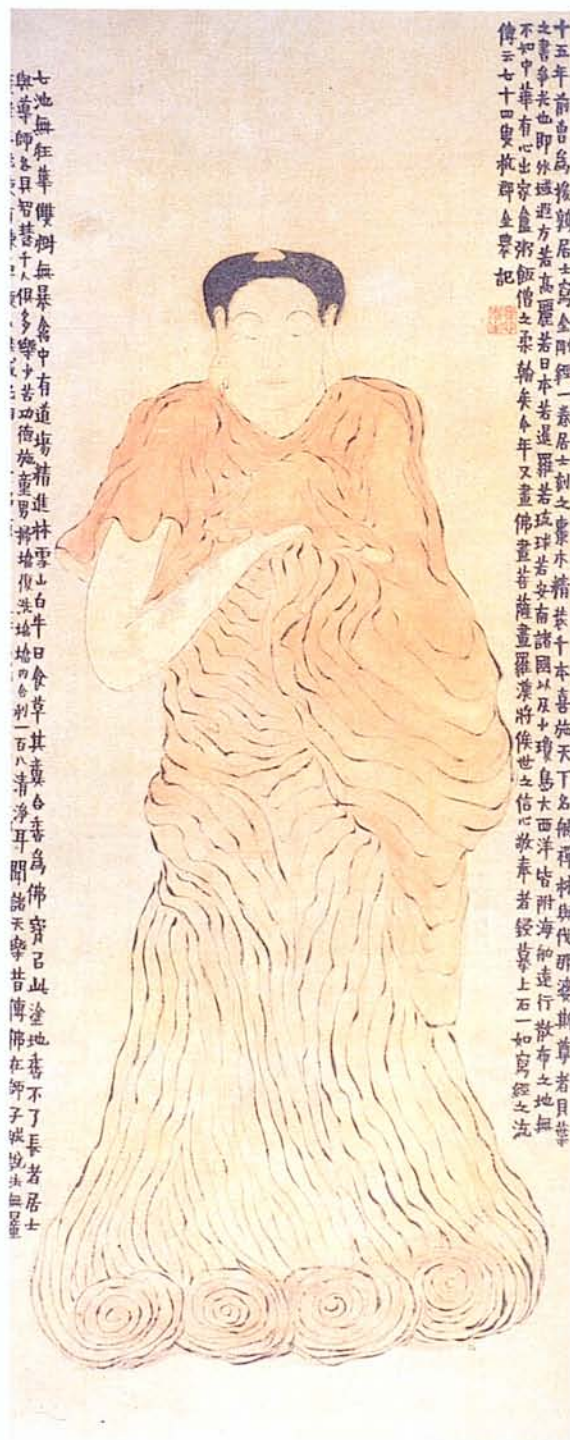
▲清 金農 《佛像圖軸》(圖七)