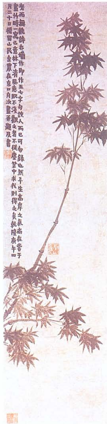
▲清 金農 《墨竹軸》（圖二）