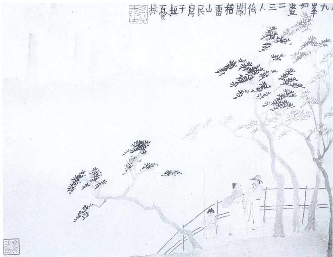
▲清 金農 《山水人物冊之一》（圖十一）

內在所蘊涵的奇氣，引人如入畫中。如圖十一所見，「八九峯如畫，二三人倚闌。」樹幹以赭墨，配以朱闌青峯，自有大氣洋溢於虛無中，耐人尋味。而採菱採蓮等圖趙孟頫和唐寅均有作品，圖十二作湖