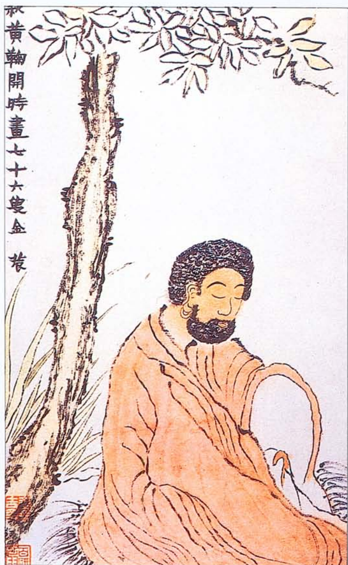
▲金農 〈菩提古佛圖〉(局部)