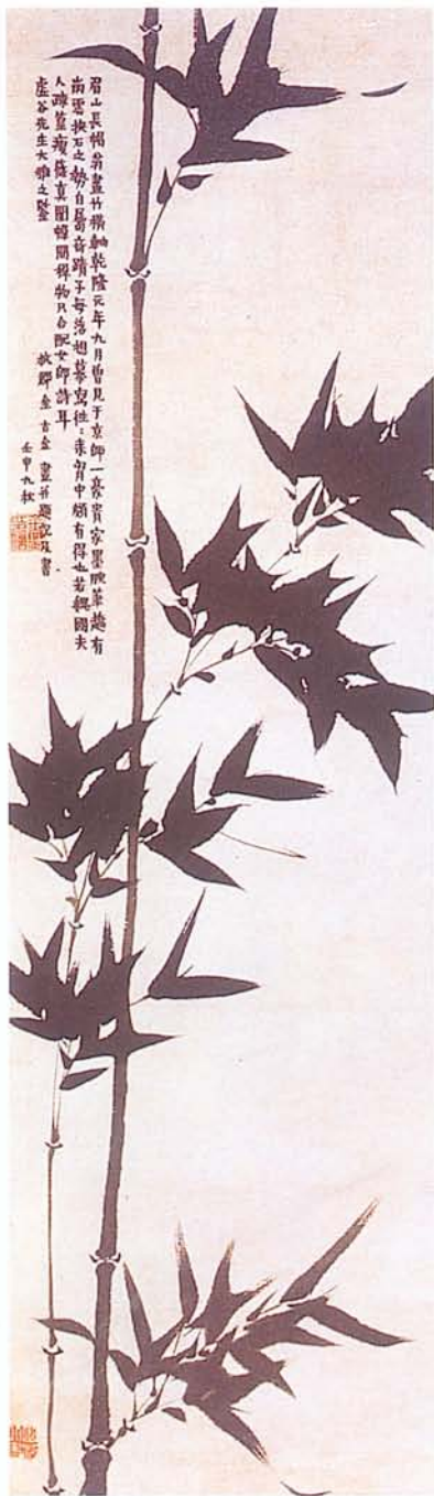
▲清 金農 《墨竹軸》（圖一）