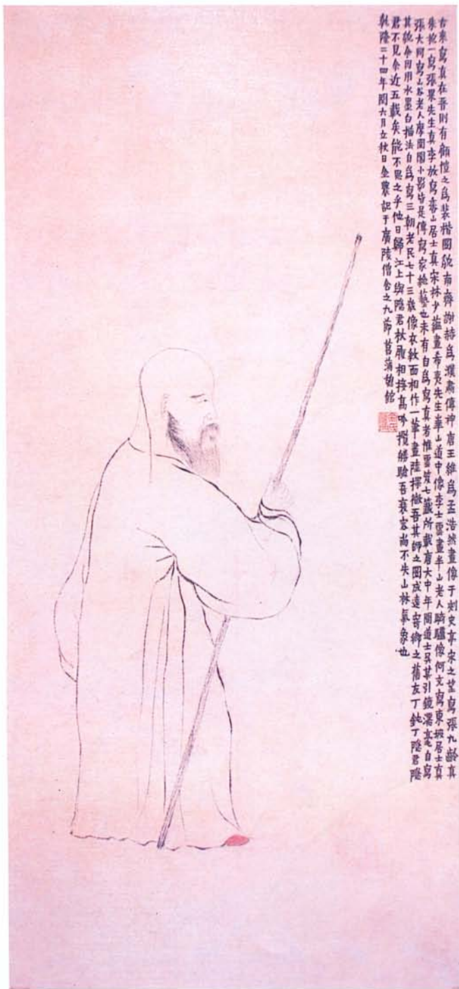
▲清 金農 《自畫像》(圖六)

成熟後逐漸發展完成的。款署的年月大都於七十歲前後。揚州諸家中人物畫得好者很多，除黃慎專以人物知名外，肖像大家禹之鼎也寓揚州，高其佩的簡筆人物以神情特出知名，華嘉的精細筆法，閔貞以類似黃慎的草書方法，都名重一時。而金農與其弟子羅聘，却以高古拙樸獨擅勝場。金農在六十八歲左右寄寓揚州西方寺，專門從事寫經和畫佛。他的七十三歲自畫像(圖六)，足可認定為他的代表作，筆法簡鍊而刻劃生動，流暢中不失古拙，圖成後贈丁敬的。自畫像面部的鬚髯茂密，衣紋骨法雖聊聊數筆，意態却在簡中求煩，筆筆相承，如他自謂承陸探微；一筆畫，既能流暢律動，又不失顧愷之「春蠶吐絲，循環超忽」的遺意。白描法始於李公麟，從他僅染鬚眉與手杖即知已深得白描法的訣要，簡明的筆意中軀體的宏碩，穩健中復見動勢，初視或以為有所失，細視則方法規矩悉在其中。黃慎的人物以勁利恢忽勝，金農却如蟲蝕木般令人咀嚼橄欖，回味無窮的境地。七十四歲的〈佛像圖軸〉(圖七)，略師曹衣描法，衣紋結構雖於骨法不符，但釋迦正面全身，神態安詳，賦色溫潤而淡雅，衣紋如卷雲般升騰動盪，古穆中自成韻律。又如圖八之〈羅漢圖〉，人物用筆極簡，但