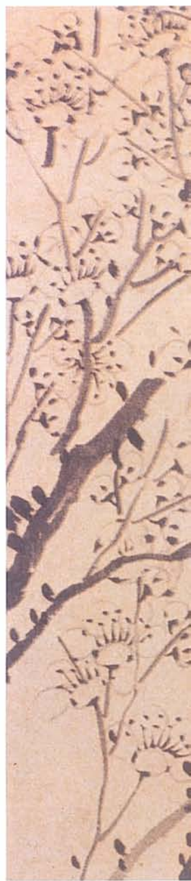
▲清 金農 《梅花圖冊》(圖三)