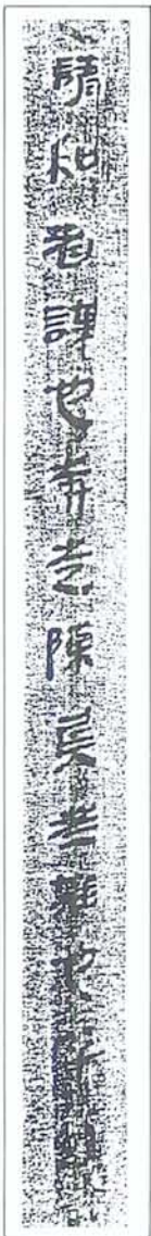
圖七 臨沂銀雀山漢簡 《孫子兵法·行軍》

自圖一楚帛書至圖七銀雀山漢簡，所特加指陳諸字，可見楷書自戰國時期隱微已發，而西漢中期芽根已萌；其間書體初蘊，形姿始立，藏楷質於隸體，露指介於甲端，只憑秦石漢碑之初刻椎拓，而不見秦簡漢牘之筆書墨跡，固不能識楷書之孕育也。