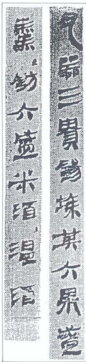
圖五 馬王堆漢墓竹簡

孰若機以收功 實色色律 通凡夫以以即 既終亦又二千日 是如之以左地亦 是如夫以況我亦 并立皆是地亦 雖僅亦之於以 得亦 秋子者新文品 悔亦云者