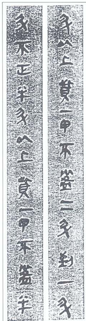
圖四 蘇州虎丘秦簡