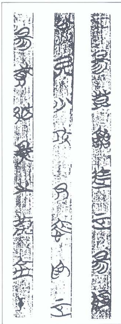
圖二 包山楚墓竹簡

是也夫以以左地有 是也夫以以左地有 是也夫以以左地有 是也夫以以左地有 是也夫以以左地有 是也夫以以左地有 是也夫以以左地有 是也夫以以左地有 是也夫以以左地有 是也夫以以左地有