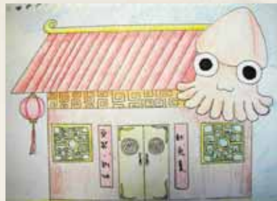
圖13 「長安上河圖」— 平面創作2。

以改編並創作成立體的月曆，由藝術品發展為日常生活的實用物品，練習藝術和設計的結合，並學習立體創作的相關知識與技巧。