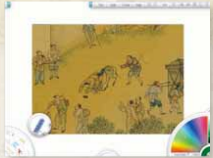
圖5 教師事前安裝之繪圖軟體與作業圖檔。 （免費平板電腦繪圖軟體 ArtRage 1.1）

技術專家、資源提供者、行政人員等之目標（Hanna, Glowacki-Dudka, & Conceicao-Runlee, 2000）。