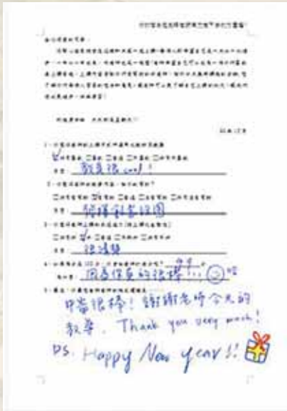
圖19 學生活動回饋單1。