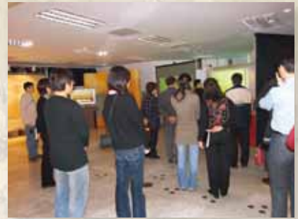
圖18 成果展進行之情形。