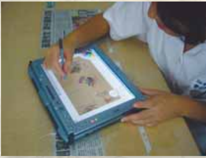
圖1 學生使用平板電腦進行數位創作。