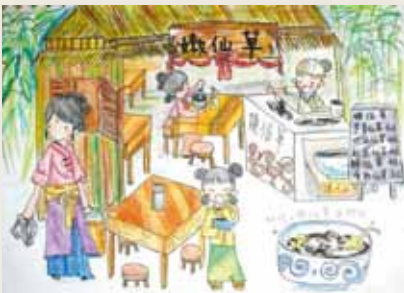
圖12 「長安上河圖」— 平面創作1。