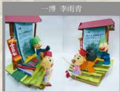
圖14 「上河月曆」— 立體創作1。