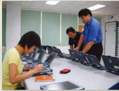
圖4 中崙高中協助中山女高教師學習平板電腦之使用。