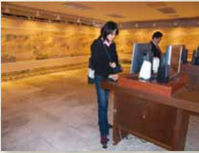
圖3 清明上河圖多媒體特展會場（中崙高中圖書室）。