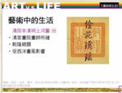
圖6 教師課堂教學簡報。