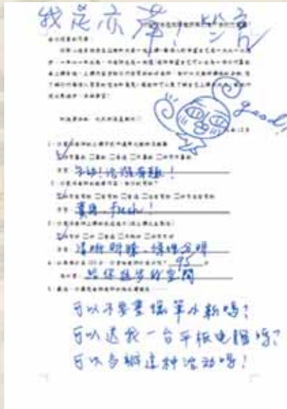
圖20 學生活動回饋單2。