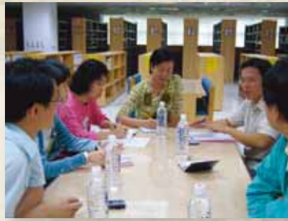
圖2 中山、中崙、故宮三方團隊討論情形。