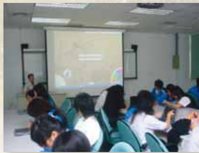
圖7 學生前往中崙高中瞭解活動進行方式，學習平板電腦之使用。