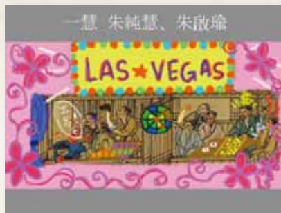
圖10 學生平板電腦創作作品1。