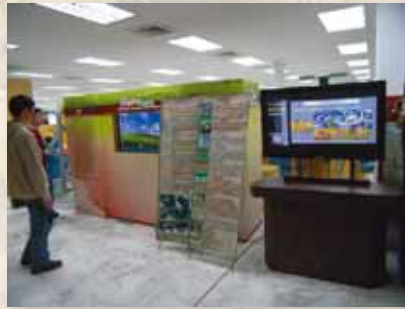
圖17 中山女高液晶螢幕與海報展示區。