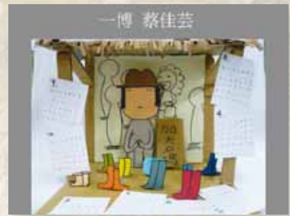
圖15 「上河月曆」— 立體創作2。