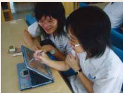
圖9 學生利用平板電腦改編清明上河圖。