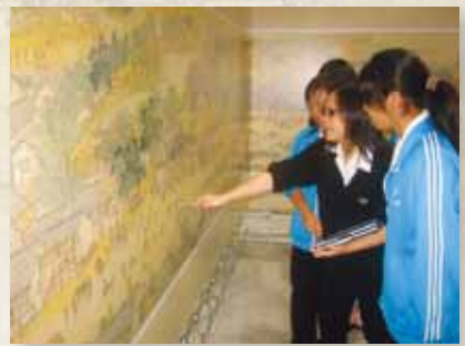
圖8 學生參觀清明上河圖特展，研究作品內容並討論。