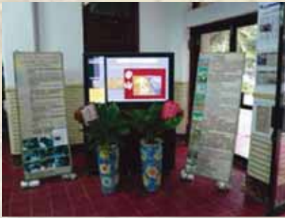
圖16 中山女高109屆校慶「走出上河圖，走入長安城」教學成果展。