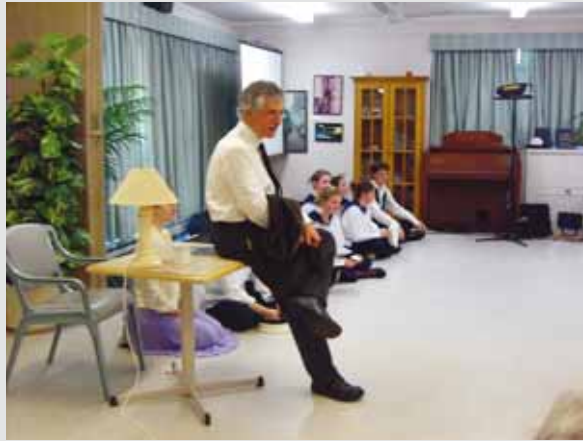
圖5 第四階段時演員（包含老師）與老人觀眾討論