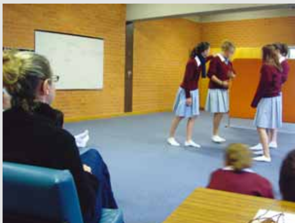
圖4 第五階段時教師觀賞學生呈現