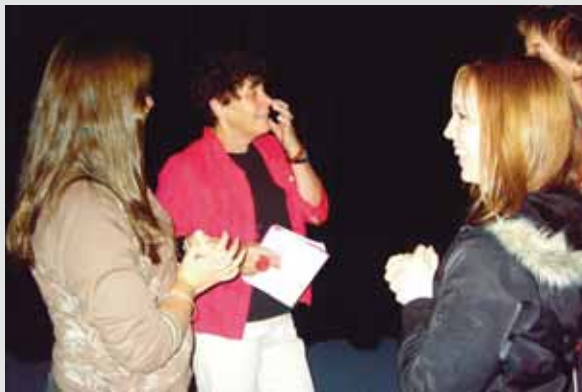
圖3 第三階段時教師至小組關心討論狀況