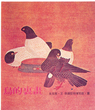
▽「畫裏的鳥」封面（國立故宮博物院）

不在於訓練我們的孩子成爲一個小畫家，而是希望他們不但發揮了自我的創造思考能力，並且能夠瞭解過去的人類文明，能適應今日的現實生活，以及展望未來，這樣才是達到美勞教育的最終目的。