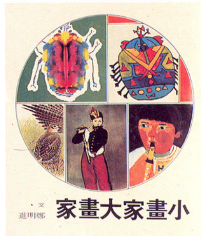
▽ 中華叢書：「小畫家大畫家」封面

(四)要提供更多有關畫家、雕塑家、設計家等等的人物傳記，讓孩子們去發現這些人的創作過程，以及他們成功的背景因素等等。