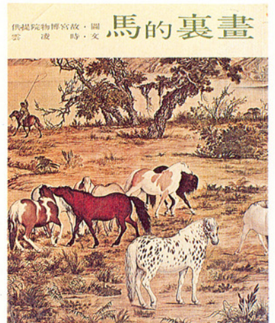
▲「畫裏的馬」封面（國立故宮博物院）

↓本文作者在策劃公共電視「兒童積分世界」（美術類）時，所製作「未來世界——集體創作」節目的其中一幕