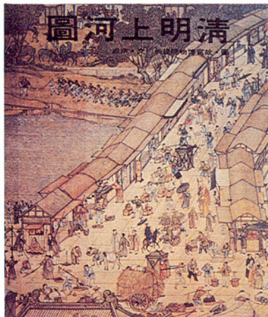
▽「清明上河圖」封面（國立故宮博物院）

(二)從閱讀良好的圖畫書插圖、觀賞電視節目、海報、電影、建築、工藝品、民俗藝術等等，去接近美術作品，從趣味的引發來培養鑑賞的能力。