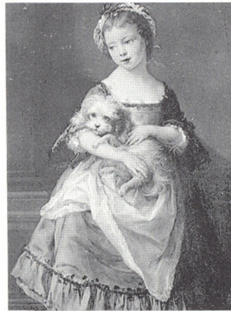
△抱狗之女伯爵·巴托尼龐貝歐 1708~1787