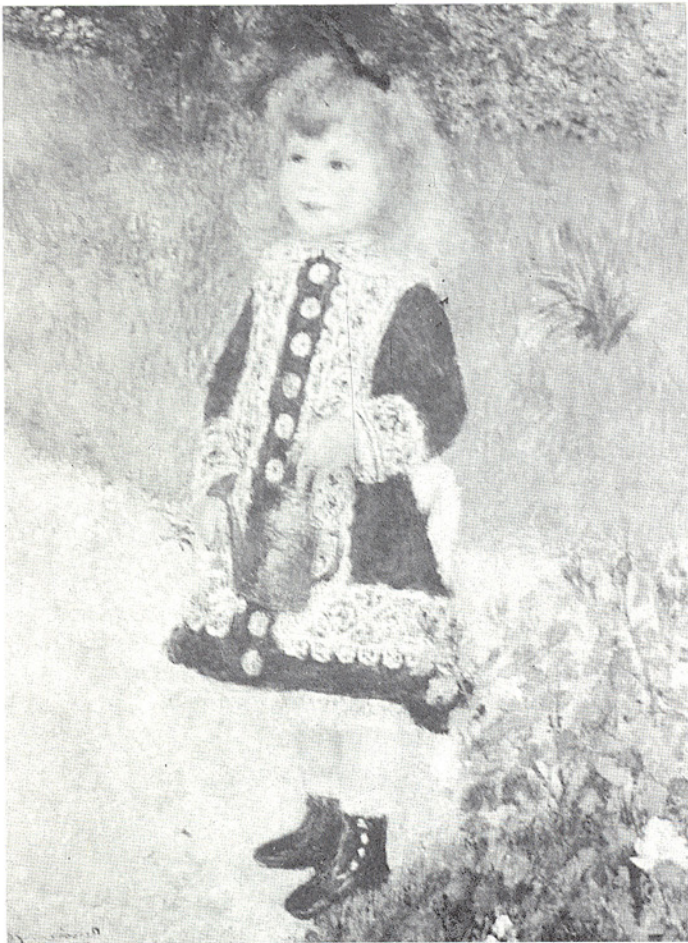
△女孩和灑水壺，雷諾瓦(1841~1919)