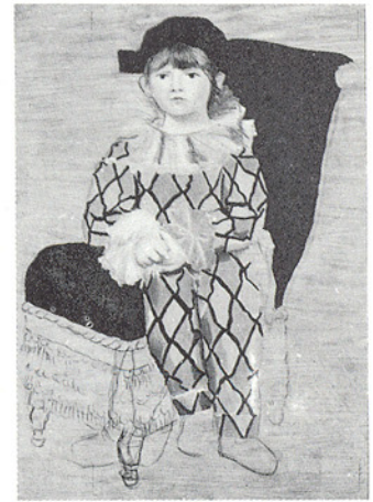
△藝術家之子·畢卡索

學生對美術作品的「體驗」、美術作品的「形式」、「象徵符號」、「主題」，及形成的文化上或創作上的「環境背景」等，均為教學時的說明及解釋的重點。