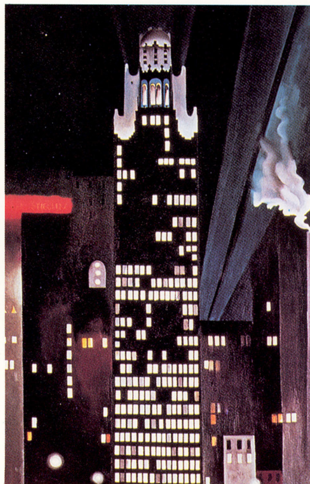
△喬琪亞·奧姬芙：夜晚的無線電大樓，紐約