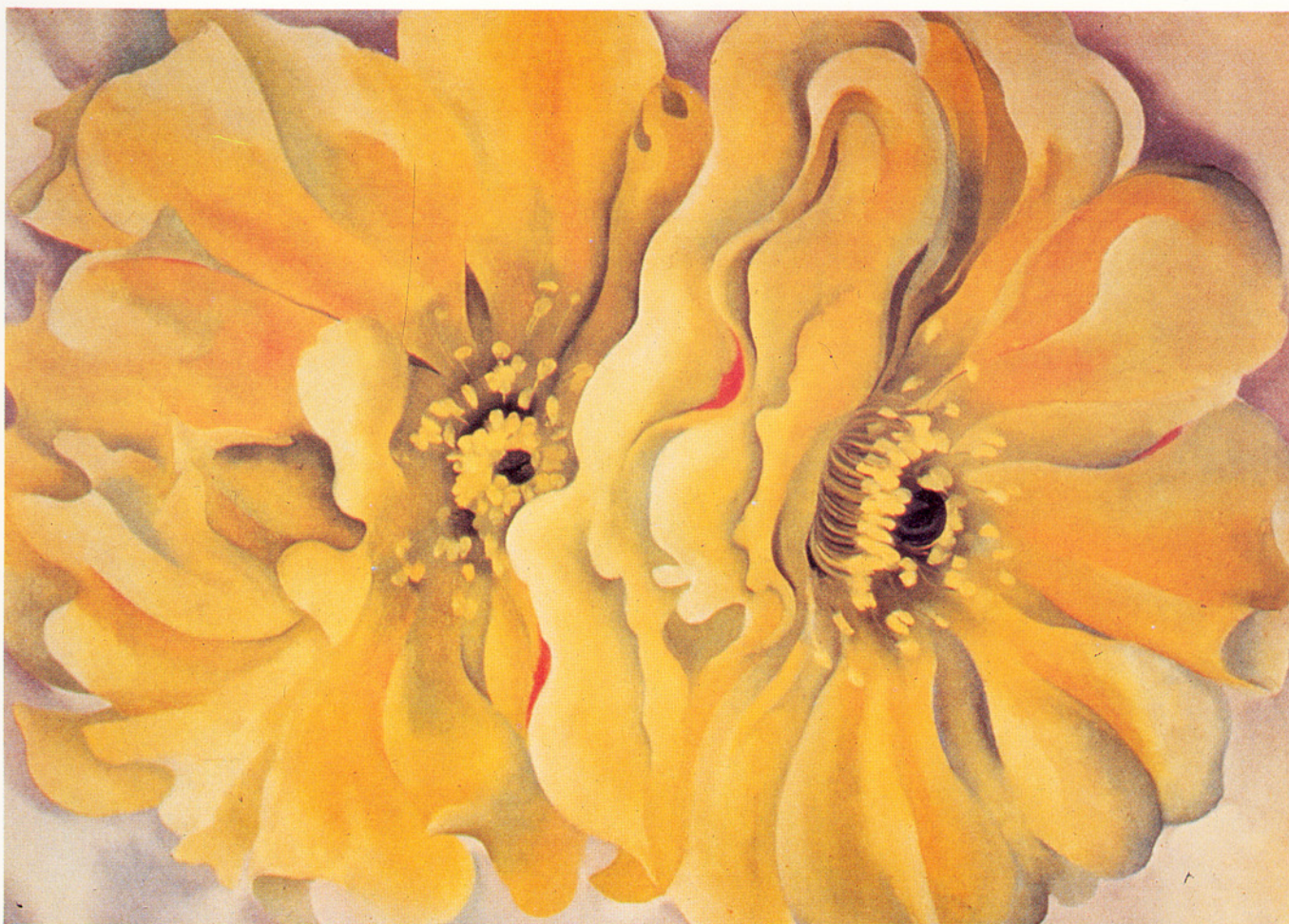
△喬琪亞·奧姬芙：黃色的仙人掌花

整個畫面—或是黑色鳶尾，或是黃花菖蒲，或是荷蘭海芋。幾從二〇年代中期開始，當這些作品第一次在史提格勒茲的「291」畫廊展出後，就被詮釋成帶著性意味的意象，加上奧姬芙既已成為女性主義的偶像