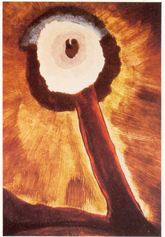
△亞瑟·道：月亮，1935（見年表）