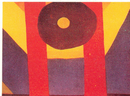
▽亞瑟·道：紅色的那個(見年表)

影響力。)史提格勒茲後來成為奧姬芙的贊助人，自一九一七年始，為她開過二十次個展，拍過五百張她的照片。