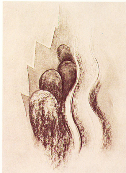
▽喬琪亞·奧姬芙：素描 13 號

古的永恆，很難不從這對照的意象中捕捉到一些處理過程正在醞釀之中，它是超越單純形式及事實之外的。這點從她畫花的作品觀之，尤為真實；那些放大的特寫，填充了