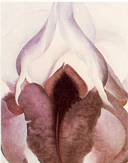
▽喬琪亞·奧姬芙：黑色鳶尾花

之一，這種說法更不可能改變。儘管奧姬芙總是嚴厲地加以否認，但在當時，她處於一個比較虛偽的世界裡奮鬥，一般來說，那個社會總是比較不願接納女性藝術家的嚴肅性。要對抗這種壓力的方法之一，就是強調形式的及植物性的一面，而非象徵的及性的意義。在一段著名的陳述中，她宣稱道：「我不是一個女性藝術家。」她一生的工作就是反對成為二等藝術公民的持續表白。