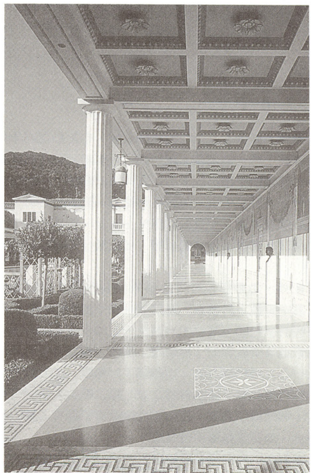
▲Getty Museum 東側主柱廊

的支持與推廣，不斷的評鑑、改進，歷經六年的推行「以學科為基礎的美術教育 (Discipline-Based Art Education)」已成為今日美術教育的主流，而該協會主張的精緻的美術教育，對學生的學習有較高的期望，其課程乃力促一個包含廣泛學習美術的途徑，透過此取向，學生應當能學習到如何發展、表現和評估觀念，在這逐漸趨於視覺取向的世界中練習視覺意象的創作、閱讀、和解釋，並了解和認知文明世界的美術成就與展望。