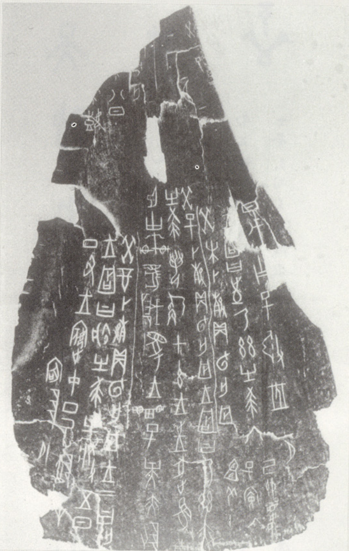
▲祭祀狩獵塗塗牛骨刻辭

甲骨文目前出土約十五萬片，單字總數計五千餘個，甲骨文已有象形、指事、假借、形聲、會意和轉注字，即所謂「六書」，是相當成熟的字體，已足為當時記錄語言的工具。中國的書法藝術只有在漢字發展到一定的成熟階段才能產生；甲骨文的發現，為研究漢字本源和書法藝術的發展，提供了珍貴的直接資料，從甲骨文字的記載中可以看出商代的天文、曆法、醫學、藝術等各方面都相當發達。從甲骨文的書體風格中都顯示出遒勁挺拔而富有立體的感覺，而結體又都自由活潑、布局參差錯落，可以說在甲骨文中不僅看到豐富多彩的形體美，在書寫上也具有了用筆、結體和章法三個書法要素，可以說為中國書法藝術史揭開了帷幕。