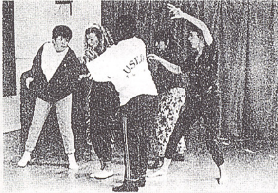
▲藝術治療中心理劇的運用