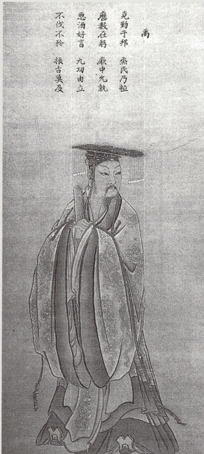
▲具有教化作用的圖像 馬麟 夏禹王像

2.教學方法 (teaching/learning method)：是指教師該如何教？學生該如何學？的問題。