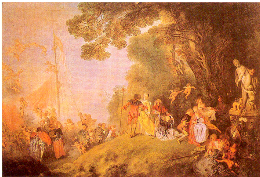
■藝術美的基礎是奠基在自然物的模仿中

在我們精神方面，我們的理智、意志，配合著感覺知識與感情，讓人感到實在是美好無窮，人天性