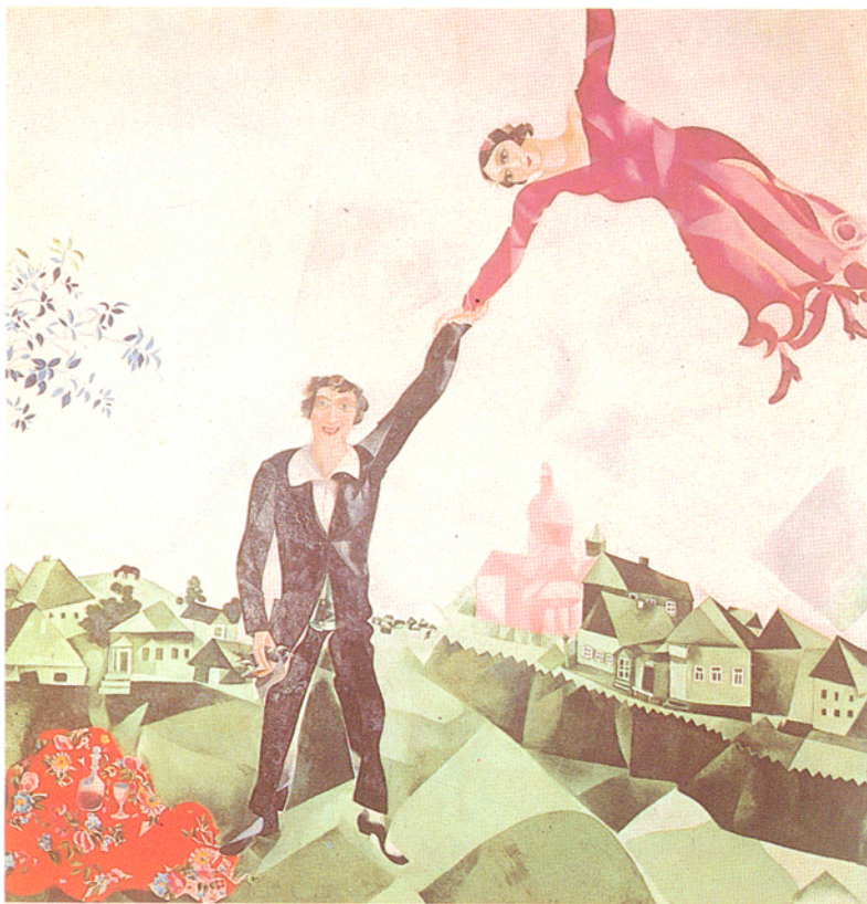
■繪畫是以人類的精神，加上自己的肉體，利用有形的工具，採取世界上具體與想像的形體的表現