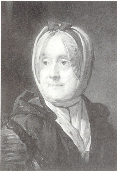
■有愛在心中的人，別人看著他的美麗天成，他看別人也是如此