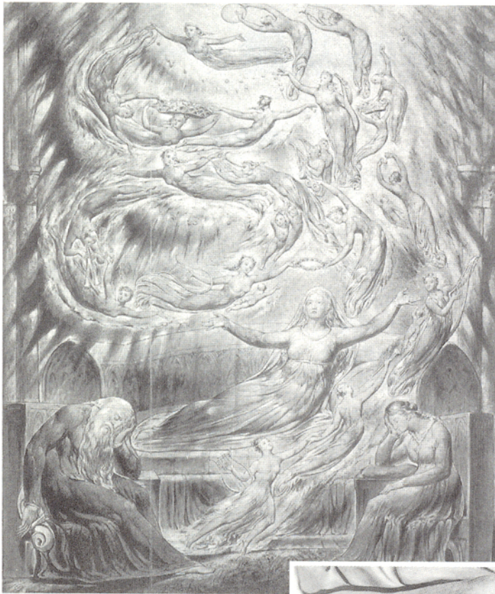
■人有意無意的，都將自己的人格、性格、理念、思想，蘊藏在他的作品中