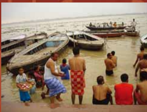
在恆河邊齋戒沐浴的虔誠印度人