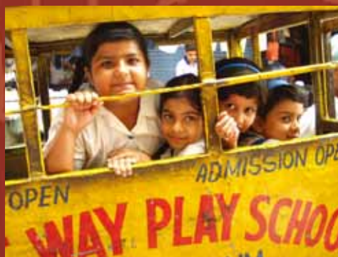
印度小學生乘坐三輪車快樂上學去