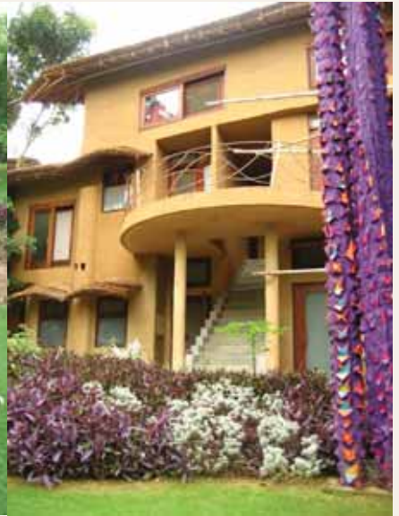
駐村藝術家宿舍