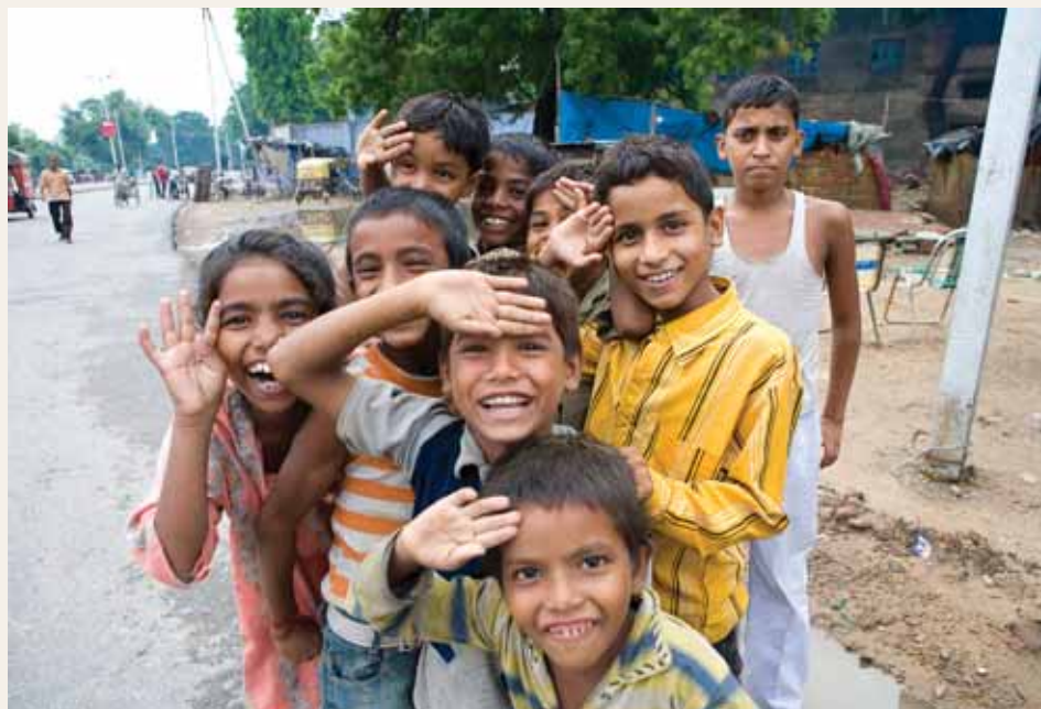
阿格拉印度街頭天真活潑的孩童

也許是這種陰性柔軟的包容力的關係，讓他們一樣也經歷了世紀早初西方帝國殖民宰制、經濟文化侵略後，仍維持他們強大的文化傳承，一點也沒因此自卑或矮化自身的文化，這點，是印度可取之處，不愧是發明了阿拉伯數字「0」的種族。