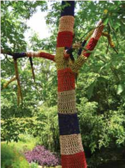
藝術村戶外裝置作品