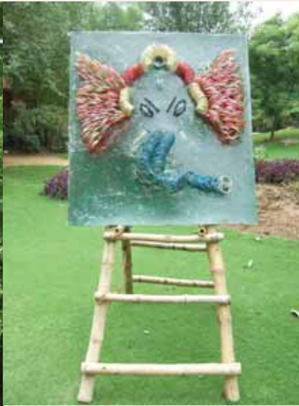
藝術村戶外裝置作品