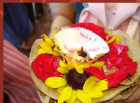
敬拜河神的貢物