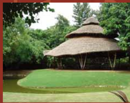
每日瑜伽大廳

就在2007年夏天研究所畢業在即，有幸獲知通過了全額補助的駐村申請，應邀至印度新德里國際藝術村（New Delhi Global Art Village）駐村一個半月，同時揭開了57天印度藝術駐村暨自助旅行的序幕。這雖非我頭一次到印度，但此行仍同初次般帶著欣喜和企盼。