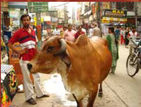
新德里街頭聖牛橫行