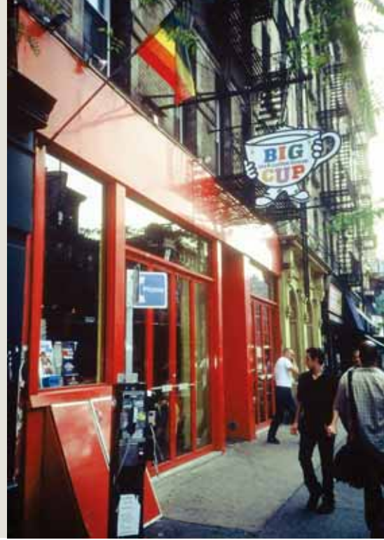
「大杯」Big Cup是著名的「釣人」咖啡店。

我是不喜歡紐約的。除非生命中還有其他的因緣際會，不然應該是不會想主動再次拜訪了。他們叫這個城市大蘋果，是種族熔爐。我倒覺得它有點爛了，有太多的歧視在裡頭。白人優越主義與有色人種的角力；階級與階級的對立，電影中的描述都不夠外顯。