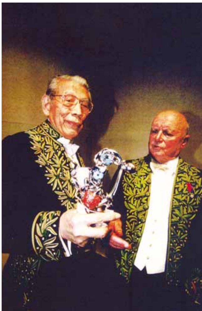
朱德群於1997年12月17日被提名而當選「法蘭西研究院美術院士」。

凱瑟別出心裁使用字形相近的三個詞彙：“Fusion”（融合交乳）、“Effusion”（感情抒展）、“Diffusion”（散發傳導），來詮釋朱德群的藝術境界（cf. Carnet Culturel ）。朱德群的藝術是表現他與大自然「物我兩忘」的大融合，是靈性的境界；朱德群的畫面是極度的抒情充滿光暈，是山靈地氣宇宙能量的代言人；朱德群的色彩與明暗的處置得宜，畫中散發出一股蘊含生命活力的發光體，引導著觀賞者亦隨之心神嚮往，淨化人的性靈。