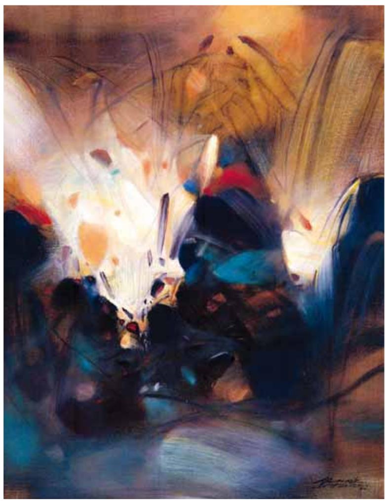
《希望的來源》 1994 畫布上油彩 50 F 台灣印象畫廊

後者，重感性講韻律。在「抒情抽象」裡，朱德群的繪畫就形式特質而言，又更明確地趨近於講究運筆姿態與氣勢的「動作繪畫」(peinture gestuelle)，但是卻與馬修(Georges Mathieu)、德庫寧(Willem De Kooning)、克萊因(Frantz Kline)、帕洛克(Jackson Pollock)有實質上的不同，因為朱德群的繪畫形式與內涵，都不是出自「自動運作論」(l'Automatisme)底下的「無意識」行爲，他畫中的形象結構，那怕是充滿動態氣勢的點、線與面的形象，都是經過審慎的考慮與嚴謹組構的結果；至於內涵，更是築基於中國山水畫裡的「虛實」、易經「陰陽」的哲理以及「生動的氣韻」(souffle vitale)，與「物質」本位的上述畫家，在精神上有天壤之別。