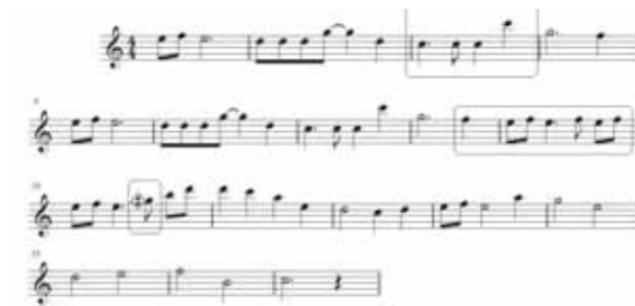
改編成C大調的《Think of Me》譜例

從學生喜愛的歌曲著手，把一些難度高的技巧隱藏其中，可以降低學生先入為主的排斥感，達到教學與學習的目的；也可以進一步將曲子改編成二部或三部合奏，增加演奏的複雜度並培養學生互相聆聽的能力。除了必教的經典直笛曲之外，一些通俗或流行的樂曲經過巧妙的改編，讓學生從中享受演奏自己喜愛曲子的樂趣，更可精進他們直笛演奏的技巧。一些程度較佳的學生甚至能夠自行吹奏課堂之外的歌曲，把音樂演奏的活動延伸到生活上，產生調劑與娛樂的作用，充分得到學習的成就感與滿足感。