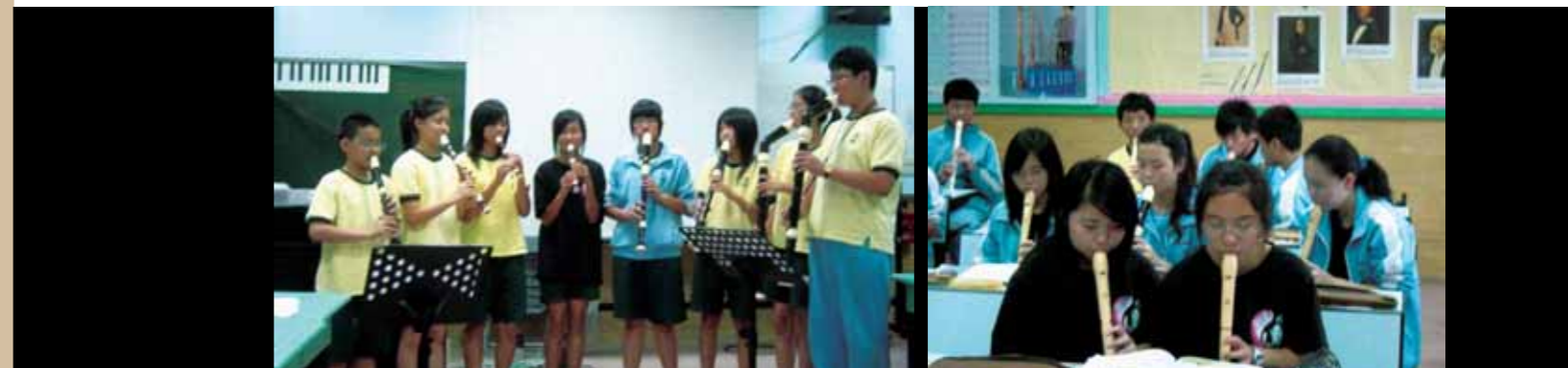
卡通歌曲改編成直笛大合奏。

力派歌手的曲子當作教材。我個人領悟到選材的重要性——選曲不能一味地迎合學生的喜愛，而要篩選歌詞內容積極正面，並能與課程連結的題材；只要選出的是學生熟悉的樂曲，他們通常能接受且願意嘗試老師上課教的歌唱技巧。例如：俄羅斯歌手Vitas深受學生崇拜，他的歌曲就可以作為假音唱法的教學範例，再將他與三大男高音之一的帕華洛第的渾厚歌聲作比較，學生很容易分辨出流行音樂界歌手的唱腔與聲樂家歌聲的不同，學生在知道怎麼使用聲音的箇中奧秘後，開口唱歌的意願當然提高許多。