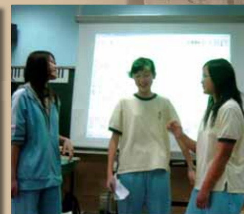
自己編劇本，演出歌劇（把梁靜茹的《暖暖》改編成《友誼萬歲》的劇情）。