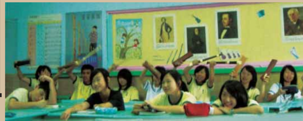
學生一邊當評審，一邊當啦啦隊。

術與大眾藝術風格的差異，體會不同時代、社會的藝術生活與價值觀。」當然其他的指標大致也都涵蓋到了。透過流行音樂與古典音樂整合式的教學，也能有效地達成九年級學生的音樂與綜合能力素養指標。至於古典與流行音樂並行的教學涉及到的跨領域議題，則包括資訊、環境、兩性、人權、生涯發展、家政等層面。