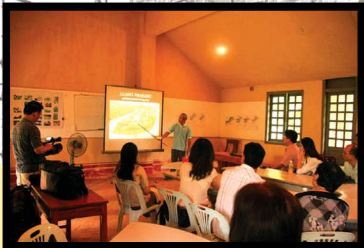
圖1 2008年暑假前往寮國世界遺產：龍坡邦（Luang Prabang）進行實地教學，同時到當地UNESCO世界遺產保存中心交流，保存中心人員和我們有一個簡短的會議，解說龍坡邦目前的保存方式與現況。