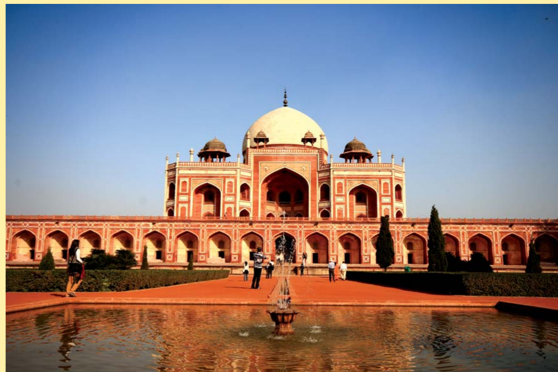
圖2 2009年寒假國際教學，我們前往印度，位於德里的世界遺產胡馬雍陵寢（Humayun's Tomb）是其中一個教學重點地方。

綜觀印尼與台灣的皮影戲，雖都是由中國大陸傳入，但隨著近代大眾娛樂工具興起，台灣皮影戲的版圖面臨迅速萎縮，而印尼人對皮影戲還是具有極大的吸引力，探究其影響的主因，在於統治者的觀念與態度。……由於印尼的皮影戲獲得有效地持續