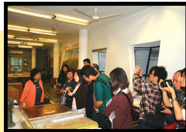
圖6 2009年寒假國際教學前往印度，與位於德里之INTCH保存中心進行交流，該組織負責監控印度全國古蹟修復、保存，同時協助修復古物，現場由保存中心人員解說古畫的修復方式。

2008年著眼於「國家藝術教育與文化資產政策」，邀請到韓國國立全南大學教育學系——羅景