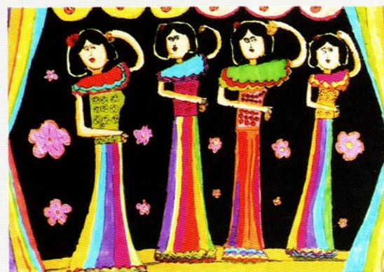
講評者：蘇振明 標題：選美舞台上 畫者：蔡慧雯・北縣復興國小 二年級

可是，這些事大部分是祖母告訴媽媽，媽媽再告訴我的，難道「文化」指的都是古人的生活嗎？