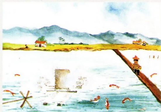
講評者：蘇振明 標題：魚池中的水車 畫者：邱榮梧·台東師院實小 四年級