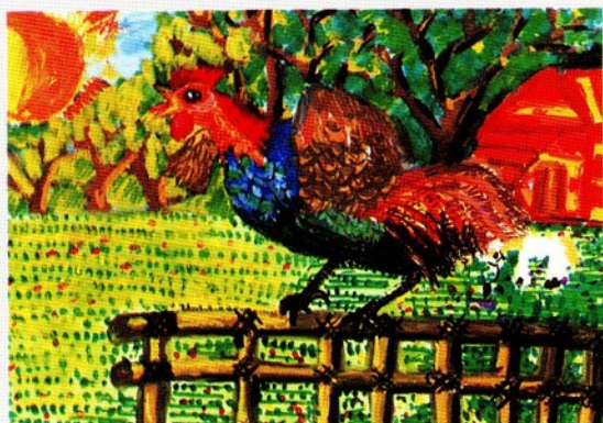
講評者：蘇振明 標題：公雞喔喔啼 畫者：陳昕伶・桃園縣桃園國小 三年級