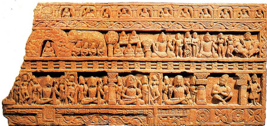
圖一 印度石彫彩圖