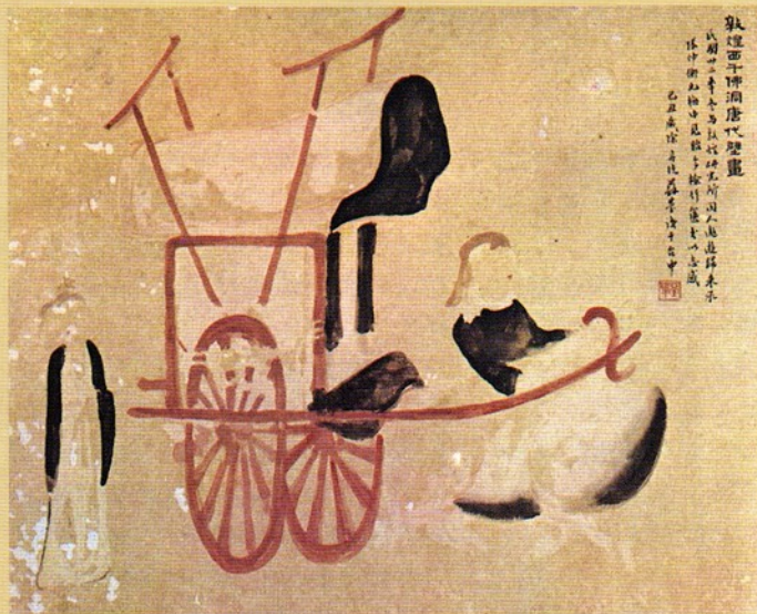
圖十三 敦煌西勒佛洞唐壁畫之二