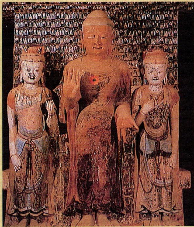
圖十 隋 427 窟一佛二脇侍像