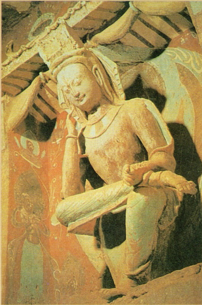
圖五 北魏思惟菩薩半跏像