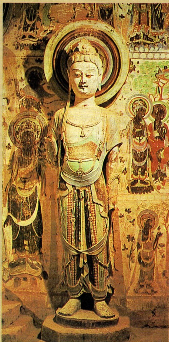
圖八 隋 244 窟左脇侍像

炳靈寺所在地之堂術（亦作唐述），舊隸河州，今屬甘肅省永靖縣，其地北臨黃河，縣治舊名蓮花城。炳靈寺，唐世名龍興寺，北宋稱為「雲巖寺」。按「炳靈」係藏語「十萬佛」之意。窟之始建，舊說在北魏延昌二年（五一三），今按：自第一六九窟墨書的題記發現後，證知遠在西秦建弘元年（四二〇）即已鑿窟塑像。堂術山一帶地質屬紅砂岩，石質較石灰岩為鬆軟