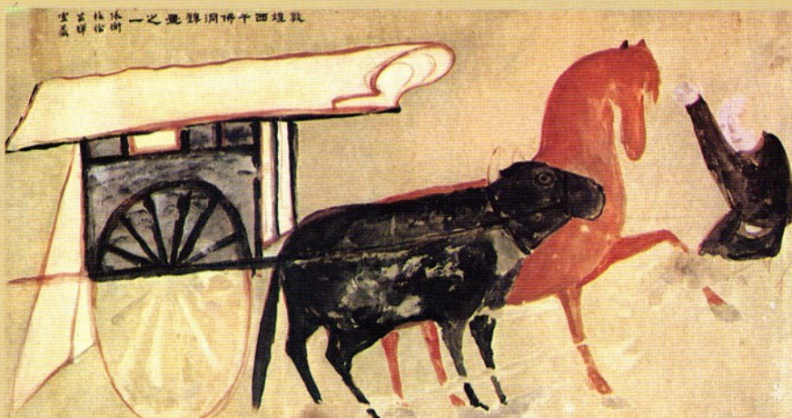
圖十二 敦煌西千佛洞唐壁畫之一

大千先生曾為該窟編號，共編二十有九號。現存各朝(據題記或繪、塑風格考知者)有壁畫、彩塑之洞窟，約計唐代六窟、五代三窟、趙宋十五窟、元代西夏人所開洞窟凡五個。按各窟皆有壁畫、彩塑遺存者，除唐塑外，還有清道光年間彩塑像三尊，較之前代塑像，不免庸俗。