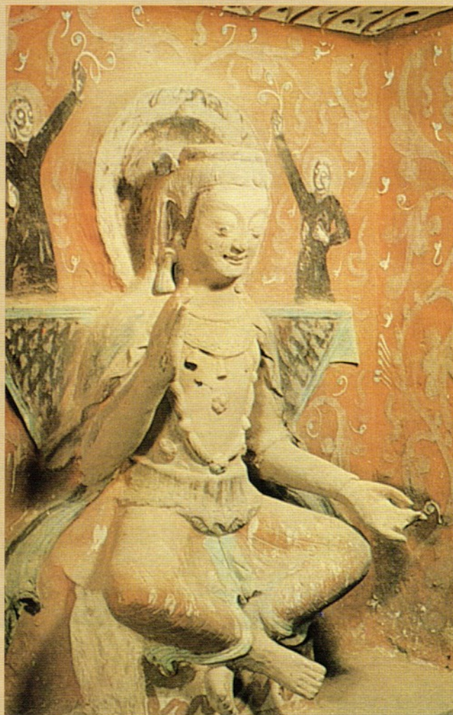
圖四 北涼275窟彌勒菩薩交腳坐像（側視）

山之炳靈寺）、河西（如沙州之莫高窟）一帶的地質，大致相同。麥積山的地質較炳靈寺稍鬆，是含砂礫的礫岩質。而莫高窟和瓜州之榆林窟亦然，（注一）同屬第四紀的礫岩質，沒有花岡岩或石灰岩那樣的堅硬，所以兩窟的等身佛像、菩薩像等，皆為泥塑木雕的敷彩圓雕式，窟內間亦有淺浮雕的佛像，至如龍門、雲岡那樣的大浮雕（石灰岩、花岡岩居多），在河隴地區就很少見了。