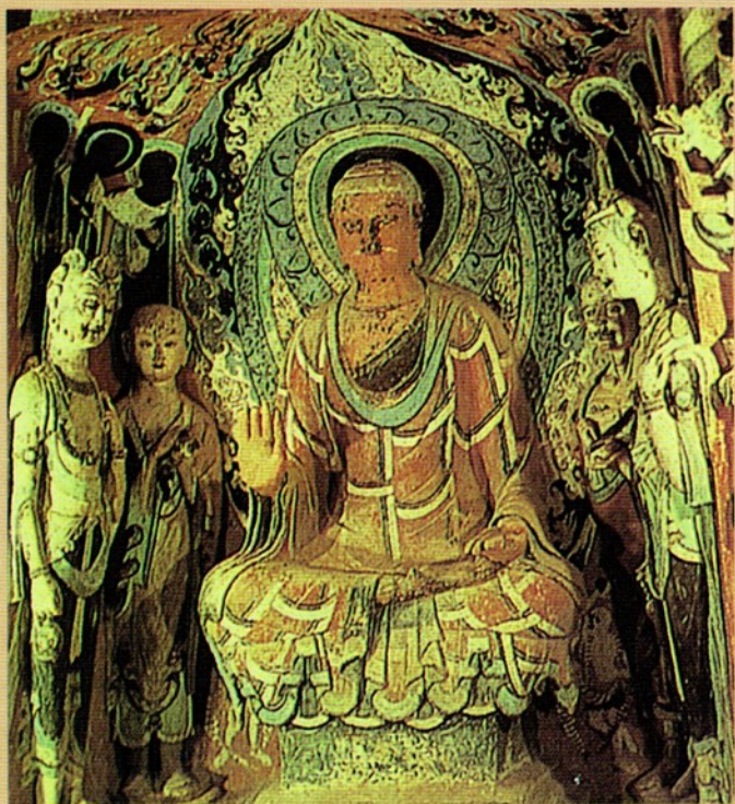
圖九 隋 419 窟佛趺坐像