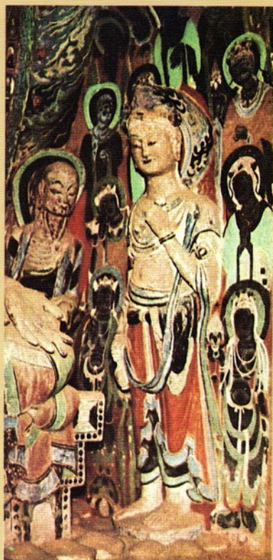
圖十一 隋420窟菩薩立像

昌馬東千佛洞。據當地文獻記載傳說，皆曾有石質雕刻的發現，但現均無存，故詳情不悉。