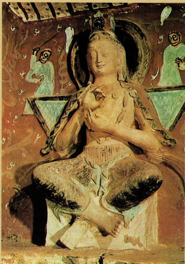
圖七 北魏 275 窟彌勒交腳坐像

位於甘肅省天水縣（古秦州）東南四十餘里秦嶺山脈兩端的麥積崖，北跨渭水，南漸兩當，五百里岡巒，麥積處其半，高百萬尋，巨石崛起，遠望有如民間積麥之狀，故以「積麥」名崖。現存洞窟一百九十多個，其中若干洞窟因地震、山洪而遭風化。