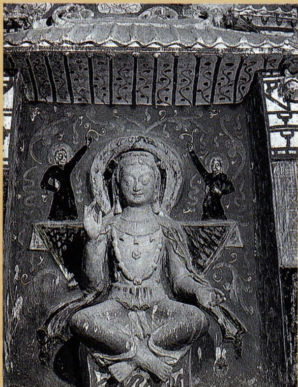
圖三 關形龕內彌勒菩薩交腳坐像