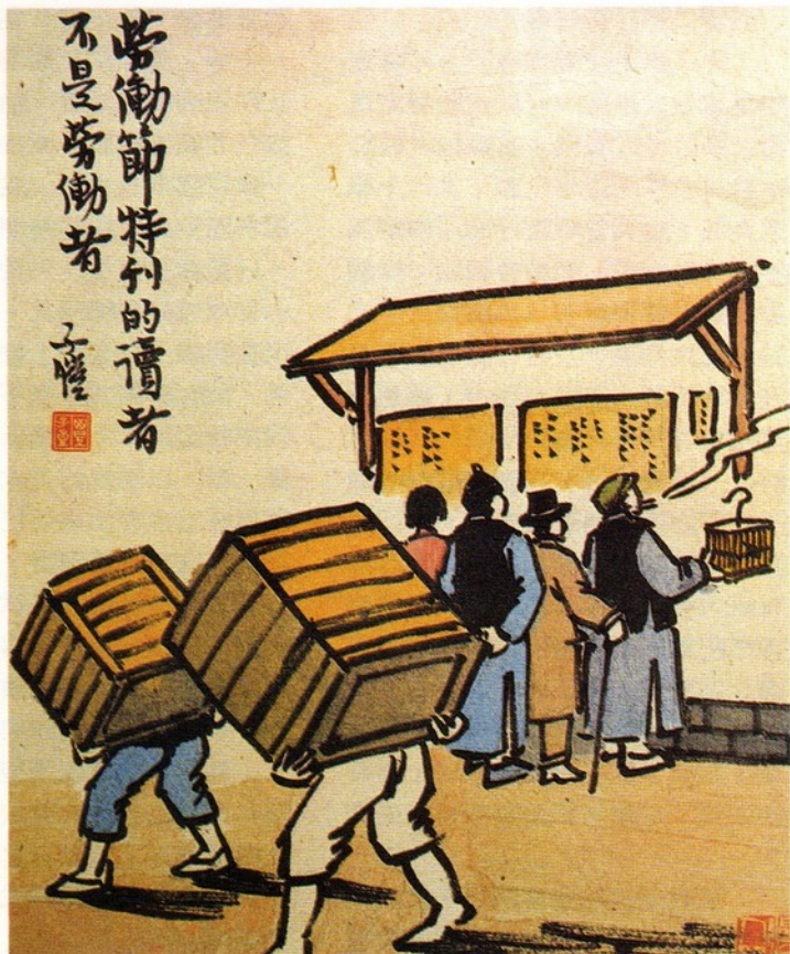
圖六 雙子愷漫畫 雙氏於清末進入浙江兩級師範學堂圖畫手工科，民國初年畢業

當時所頒佈的課程中：(1)下等小學畫學隨意；(2)上等小學幾何四卦畫大意必修；(3)下等中學畫學必修；(4)上等中學四卦畫必修。其教學法則偏重正確的臨摹出教科書上的圖形。後來由於岡倉天心和菲諾洛沙 (Ernest F.Fenllsa, 1853 ~ 1908, 美國人) 的倡導本位文化，強調東方的毛筆較西方的鉛筆更能描繪出豐富而變化微妙之線條，因此從明治廿五年起 (一八九一)，在媒材上就採鉛筆和毛筆共行之方式，然仍以臨摹教材方式為主進行。(註廿四) 我國光緒廿九年 (