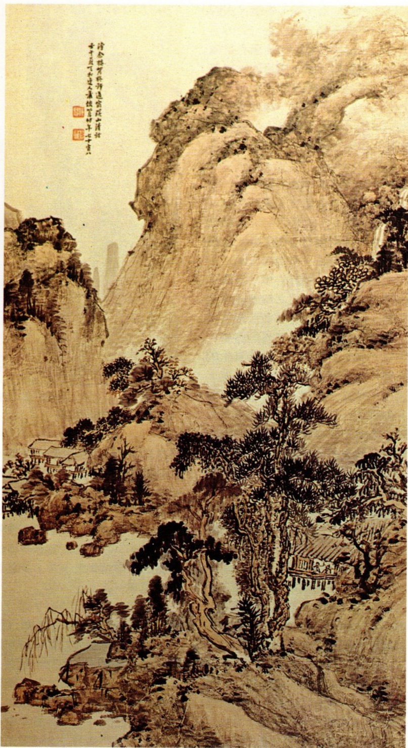
圖一 蕭俊賢（屋泉），《山水》 蕭氏曾擔任兩江優級師範學堂之中國畫教師

依照奏定師範高級學堂章程之規定，招生的範圍本限定於初級師範學堂畢業生和普通中學之畢業生，修習三年畢業。然而由於招生時尚無中學和初級師範學堂的畢業生，因此權宜地將報考資格暫訂為具備「學」、「貢」、「生」、「監」等四種身份之一者。可能也因如此，該科畢業生一律三年半方始畢業（較規定延長半年）。招生的地