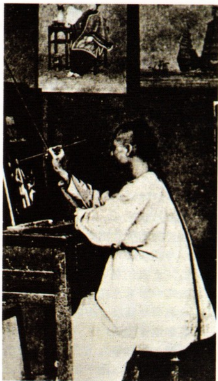
圖四 清末傳統影像舖師傅為人繪像 一八六五年