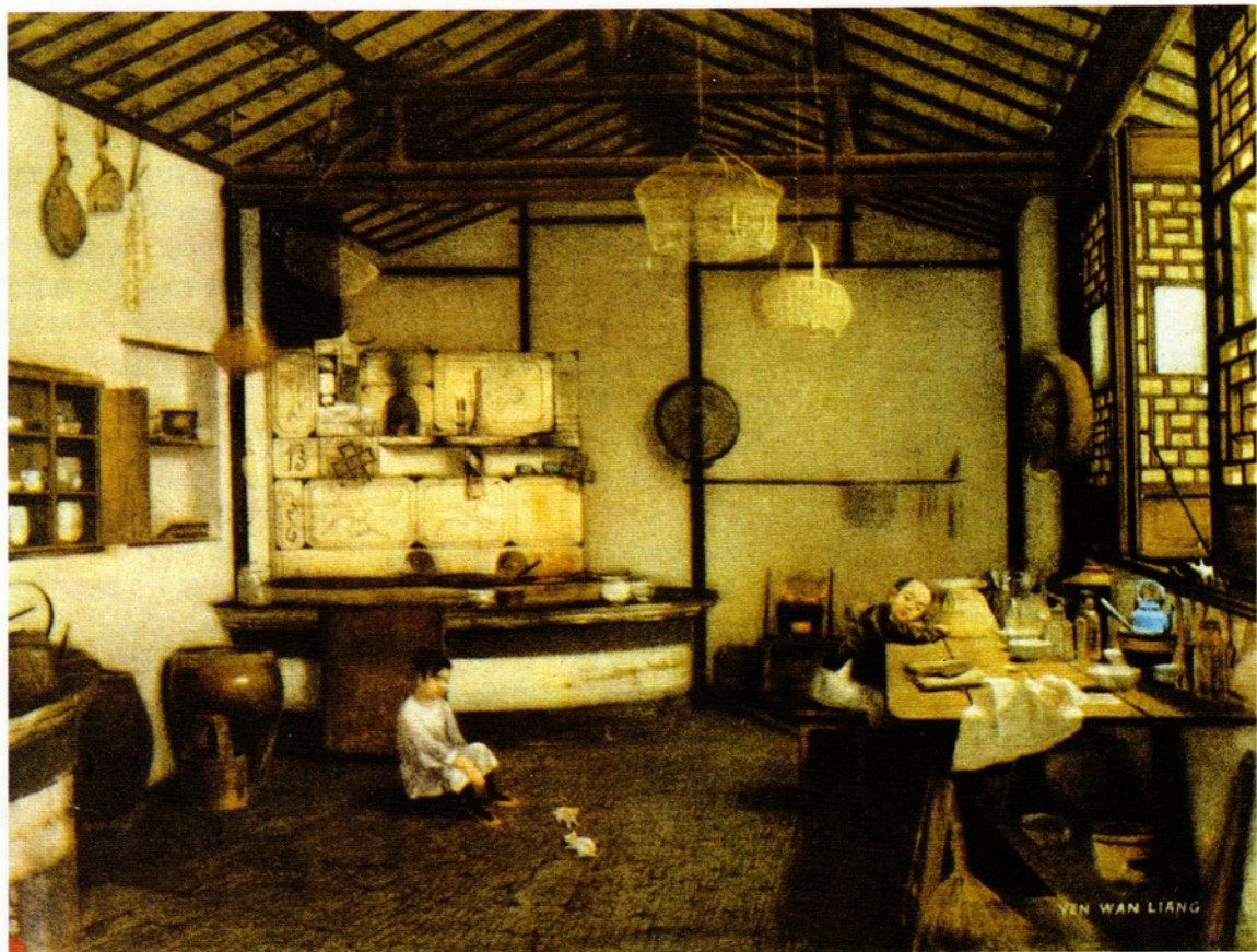
圖七 顏文樑，《廚房》色粉畫 顏氏於清末接受過高等小學美術教育，並於商務印書館接受過日籍畫家的半年職前訓練

國繪畫教育史上劃時代的新里程。同時也由於兩江優級師範學堂等幾所師範學校之圖畫、手工科的設立，以及四川藝術專門學堂等幾所藝術專門學校之相繼創辦之故，為畫家的培育，開闢了一個學校教育制度化嶄新的養成管道。