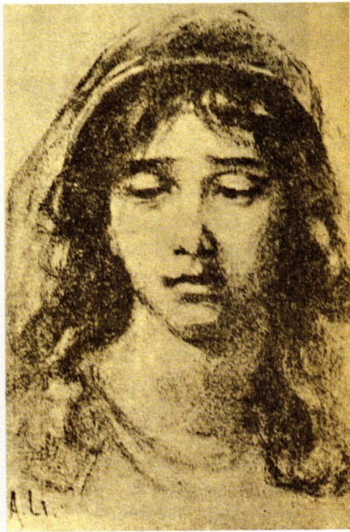
圖三 李叔同之油畫作品 李氏於清末即於浙江兩級師範學堂擔任西畫課

業自日本東京高等師範藝術科，因此制度和教學方式也仿自東京高等師範藝術科，教材多採用商務印書館出版的《鉛筆畫範本》和《水彩畫範本》。據該校畢業校友吳夢非之回憶，（註十三）其教學方法與當時的小學堂相差不多，多偏重技巧的臨摹。