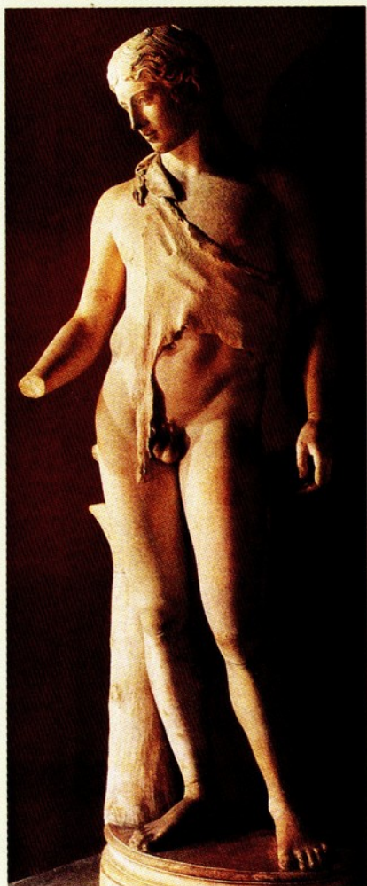
▲27.迪奧尼索斯像 大理石 原作西元前四世紀初 高 189 公分 此為羅馬時期的仿作。

少年的右肩斜披鹿皮至左腋，裸露出優美的軀體。右腿輕倚樹幹，身體重心自然地著放在右足；左腳輕向橫移，使得整體有股柔美、自然的氣氛。此外，迪奧尼索斯像的頭髮、與面部也被細膩地雕刻著，讓人憶起祂美若女郎的特徵。