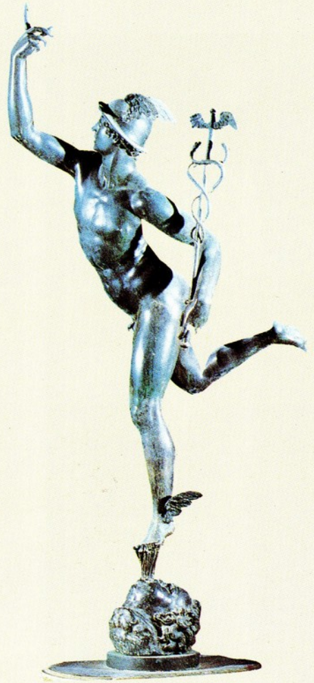
▲26.姜波隆納(Giambologna) 飛馳的哈姆斯像 青銅 西元前1564-1565

飛馳的哈姆斯，左手持著神杖，右手食指朝天，像是在接受神旨，並傳遞其意。此作故意讓哈姆斯僅以左脚尖著於噴水上，以讓人們從任何角度都看到整體作品。尚且，哈姆斯的帽子、神杖、金鞋附上翅膀，強化了眾神使者的身份，與其輕快靈活的動作。