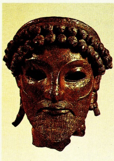
▲1. 宙斯頭像 青銅 古拙時期末 奧林匹亞宙斯神殿

宙斯既是衆神之神，祂擁有的神力必也廣大無邊。依希臘史詩之言，宙斯是氣、是大地、是天。祂可化為人形、動物等。不過從遺留至今的宙斯像，祂一直被塑成年長、尊貴、高雅的形象。同時其常有特徵是，微向上翹的下巴，上揚圓弧的鬚髯，眉毛與鼻樑相連成一優美的弧形，杏眼，卷髮，臉部諸多圓弧線性相呼應中，略下垂的短鬚，使其流露威嚴感。此頭像是人們獻給宙斯的雕像局部。宙斯那鑲著寶石、或象牙的雙眼，如今已遺失，而成兩個圓而大的洞。