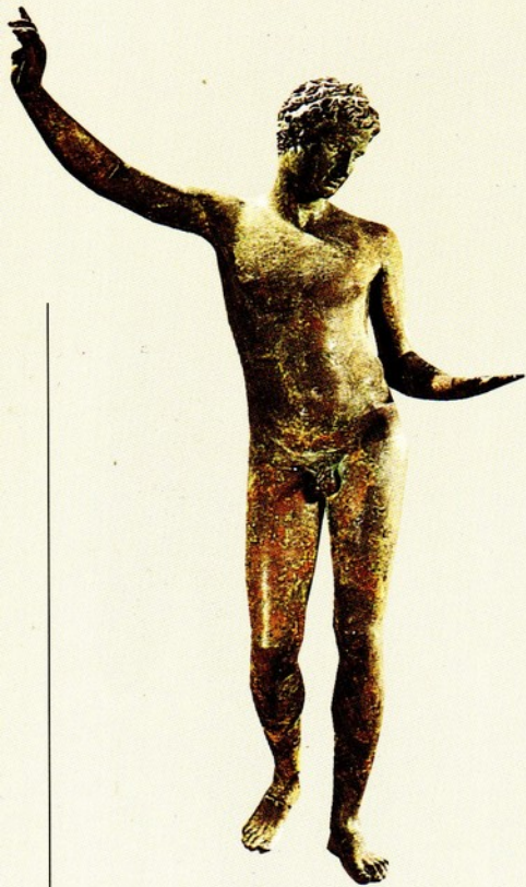
▲22.哈姆斯像 青銅 西元前330

哈姆斯左手持物，右手向後拉伸，大姆指與食指間似夾有一細長之物。人們從其憂鬱的眼神、頭上的角，認為該是正在製作七弦琴的哈姆斯。故其左手可能拿的是龜甲、右手捏著牛腸線。此時的哈姆斯，像位年輕的少年，有著修長、優雅、官能性的肉體。