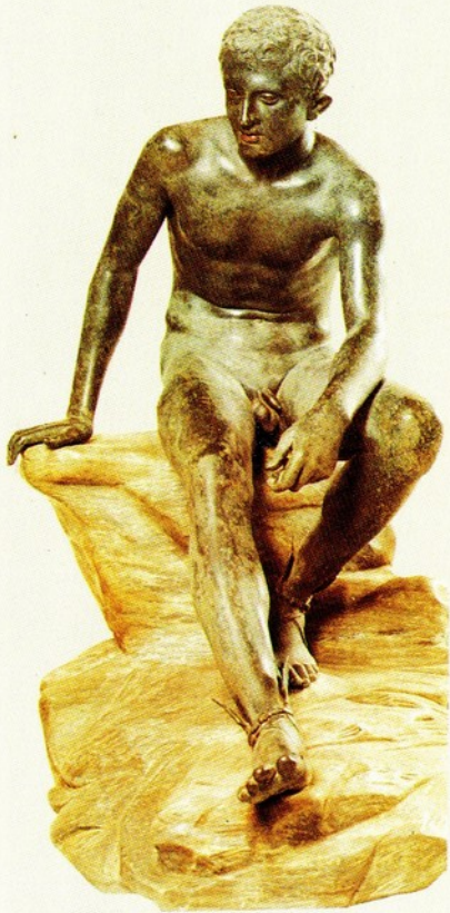
▲24.哈姆斯像 大理石 西元前三世紀 高105公分

希臘化時期的活潑、生動、現實化特色，很明顯的呈現於此作品。穿著金鞋的哈姆斯，似在沉思，又似執行完任務暫時休息一下。如果拋開金鞋，它就像個年青人的坐像。