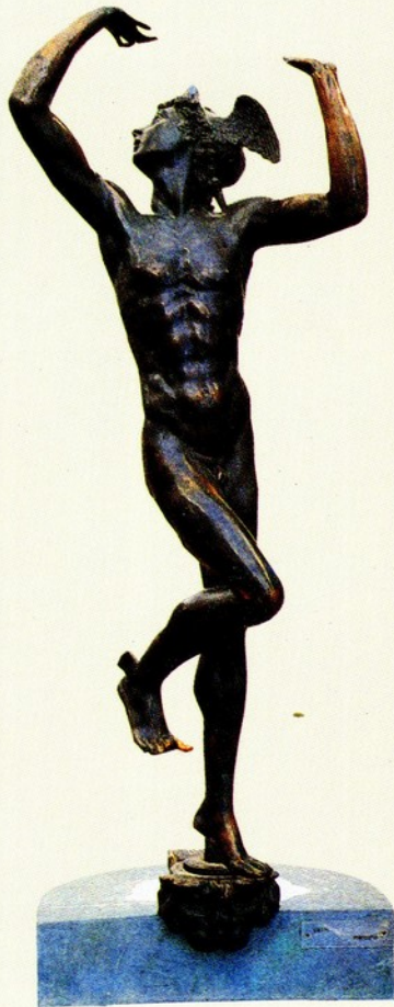
▲25.契里尼(Benvenuto Cellini) 哈姆斯像 青銅 文藝復興時期 契里尼的哈姆斯像，已穿著有翅膀的金鞋，戴著有翅膀的旅行帽。哈姆斯雙手朝天，似在接受眾神之託，以傳遞信使。哈姆斯不再是理想化的憂鬱美少年，只是個動作靈活、相當人性化的少年雕像。不過，再仔細觀看，哈姆斯雙手朝天仰望的姿勢，給予人一股承載無形重量的壓力，可說是對神話內容的再詮釋。憂鬱的特質，也不再形式化，而是精神化。

希臘化時期的活潑、生動、現實化特色，很明顯的呈現於此作品。穿著金鞋的哈姆斯，似在沉思，又似執行完任務暫時休息一下。如果拋開金鞋，它就像個年青人的坐像。