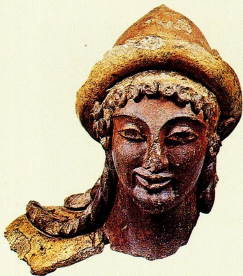
▲18.哈姆斯頭像 上色赤土陶 西元前六世紀 高37公分

由於僅存頭像，我們所看到的是哈姆斯特有旅行帽，美中帶憂鬱的神韻。如果沒有這頂旅行帽，此作可能被視為伊特坎人的阿波羅像。