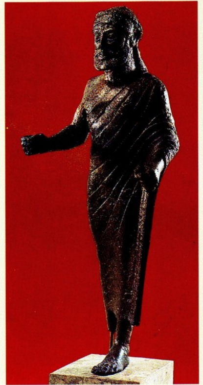
▲ 2. 宙斯像 青銅 西元前 510-500 高 79 公分 奧林匹亞宙斯神殿

阿波羅是宙斯與鐵丹族之女蕾特所生的雙胞胎兄妹。當蕾特懷孕為宙斯的妻子——赫拉知曉後，就一再地遭受赫拉的迫害，最後為海神普西頓所助，才得以生下此對兒女。兒子就是阿波羅，是神話裡的智慧之神，也是死神。阿波羅以銀