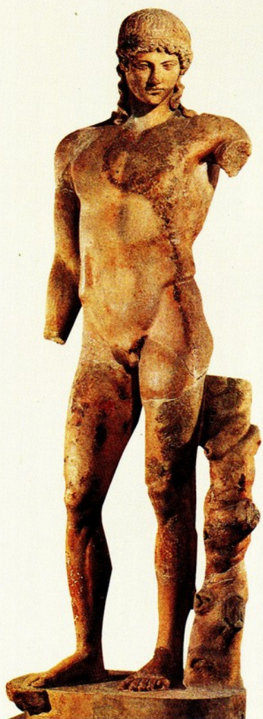
▲14.阿波羅像 大理石 原作於西元前五世紀 高 204 公分 此為羅馬時代的仿作品

阿波羅像的面孔一直是維持著一股俊秀的美感。此作除了那美麗的長髮外，其倚立的月桂樹則是其最大的象徵物。阿波羅那被理想化的人體比例、高翹的鎖骨、將重心集中於右腳所造成的動態變化，再加上其臉部神情，讓他在英挺中具有一股詩人的憂鬱。