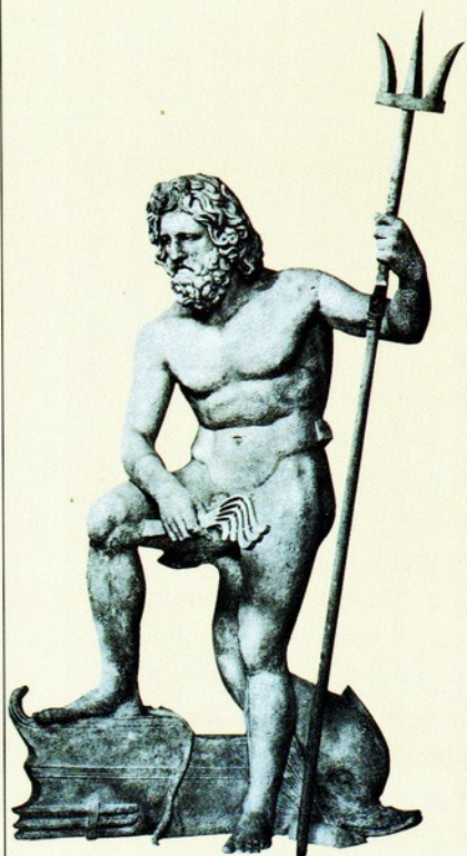
▲ 8. 普西頓像 青銅 羅馬時期

象徵普西頓特有的三叉矛，常因為人為、或天災的因素，而失落，使得其像僅可依其手掌的造形，去臆想執矛的動勢與神威，此作是少數可見其三叉矛之作。普西頓脚下有著魚類等海洋生物，左手執著三叉矛，右手拿著鞭子，讓人頓想到普西頓的另一任務，馬的管理與守護神。