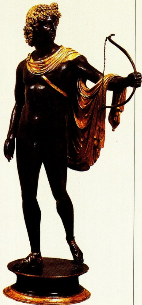
▲16.安提科(Antico) 阿波羅像 青銅 西元十五世紀末 高 40 公分

此像讓身體重心集中在略微前跨的右足，左腳僅脚尖著地。阿波羅像在過去一直維持赤裸的形式，於此卻穿著似哈姆斯的金鞋，身上背著箭囊，肩上披著厚重的披毯，性器官也覆蓋上葉片，右足邊仍有著一棵月桂樹。此外，阿波羅像的美髮高盤髻於頭頂，臉部神情莊嚴、直視前方；頸部扭轉的動勢，與人霎然有所發現的、即將執行任務的感覺。此尊像可說已涵概了希臘人理想的阿波羅像特質。