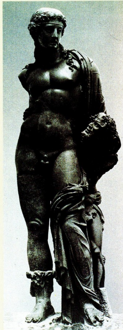
▲29.巴可斯（迪奧尼索斯） 綠色玄武岩 西元前 81-89

迪奧尼索斯的左手持著葡萄藤花環的神杖，頭上戴著葡萄藤花冠，上面還有著累累的果實，象徵祂帶來的豐收。此外，長及肩的頭髮，亦寫實地讓人感受到沒藥的氣息。祂似臨風而立，待勢而發，予人一股潛在動力，正隱約流露出。