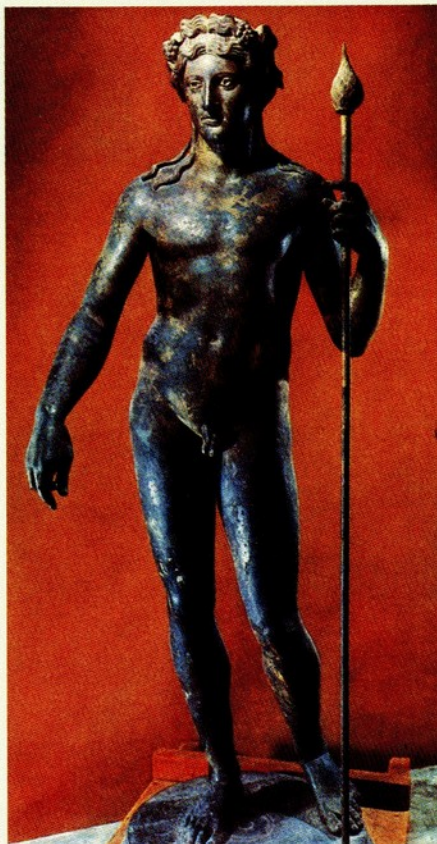
▲28.迪奧尼索斯像 青銅 西元前二世紀頃 高 165 公分

少年的右肩斜披鹿皮至左腋，裸露出優美的軀體。右腿輕倚樹幹，身體重心自然地著放在右足；左腳輕向橫移，使得整體有股柔美、自然的氣氛。此外，迪奧尼索斯像的頭髮、與面部也被細膩地雕刻著，讓人憶起祂美若女郎的特徵。