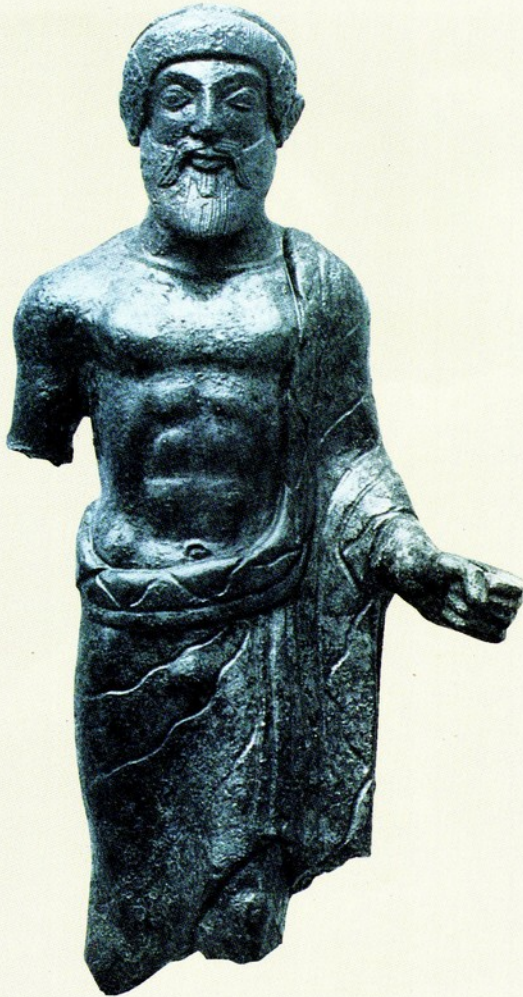
▲ 4. 宙斯像 青銅 19公分 西元前500-480 加州馬里布保羅·格第美術館藏 Paul Getty Museum Malibu California

宙斯像於此開始裸露出上半身。已斷毀的右手，從其胳膊可看出是屬於前伸的姿勢，左手仍握著已失其形的物體。軀幹的表現手法，以幾何對稱式量塊來呈現。膝腔肋骨、與腹肌的形式也與此時期的裸男像相同。可知其是宙斯的特徵，應是從其頭部造形，手掌執物、與身上所披長袍的閃電式線條來印證。