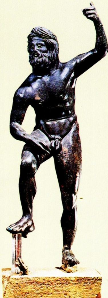
▲11. 普西頓像 青銅 西元前168 高46公分 培拉考古博物館藏 Pella, Archaeological Museum

身體重心置於右腿，右腿膝蓋向後微彎，使其肢體的動態變化更大、且較優雅；這是羅馬時代君主雕像常引用的樣式。普西頓的右手仍可看出是執著三叉矛，左手則戲劇性地扯著披毯遮著下身，厚重的褶痕增加了作品的變化。此外，祂的右腳下亦踩著海豚，象徵其統轄海洋之權。