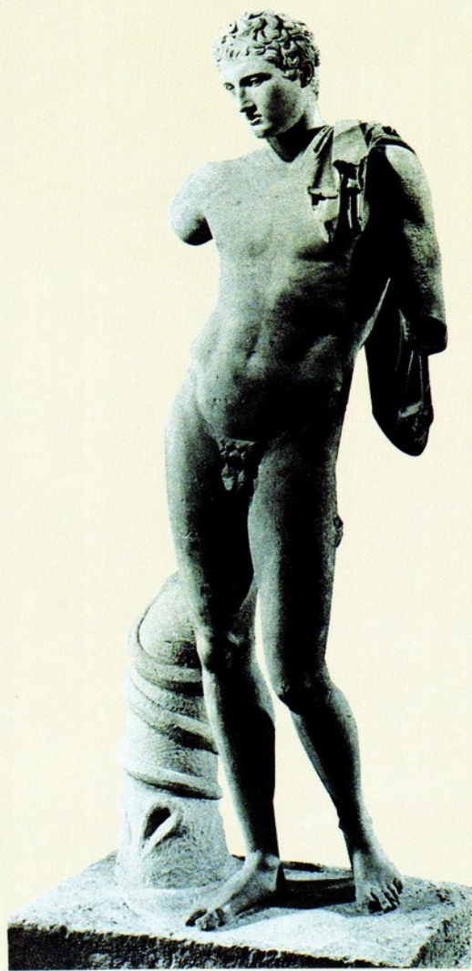
▲21.哈姆斯像 大理石 西元前340-310 高196公分

哈姆斯的帽子，被改為象徵性的有洞頭角。右腿倚靠著那蛇纏繞的樹幹。由於雙臂已毀，無法確知其是否執著傳令的神杖；但從蛇的象徵意味，似是在扮演著死神使者的角色。整體造型顯得較過去自由輕快。