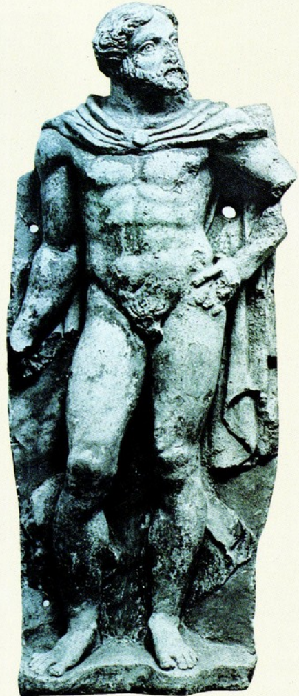
▲ 5. 宙斯像 青銅 西元前470 堪薩斯 威廉 洛克西爾 尼爾遜畫廊藏 William Rockhill Nelson Gallery Kansas City

宙斯像於此開始裸露出上半身。已斷毀的右手，從其胳膊可看出是屬於前伸的姿勢，左手仍握著已失其形的物體。軀幹的表現手法，以幾何對稱式量塊來呈現。膝腔肋骨、與腹肌的形式也與此時期的裸男像相同。可知其是宙斯的特徵，應是從其頭部造形，手掌執物、與身上所披長袍的閃電式線條來印證。