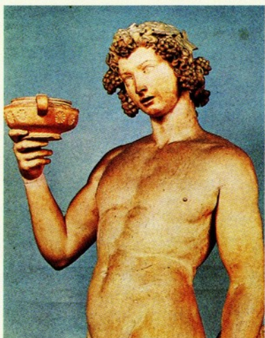
▲31.巴可斯像(局部) 米開蘭基羅 與大理石 西元前 1497-1498