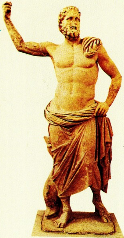
▲10. 普西頓像 大理石 西元前140 高245公分

身體重心置於右腿，右腿膝蓋向後微彎，使其肢體的動態變化更大、且較優雅；這是羅馬時代君主雕像常引用的樣式。普西頓的右手仍可看出是執著三叉矛，左手則戲劇性地扯著披毯遮著下身，厚重的褶痕增加了作品的變化。此外，祂的右腳下亦踩著海豚，象徵其統轄海洋之權。