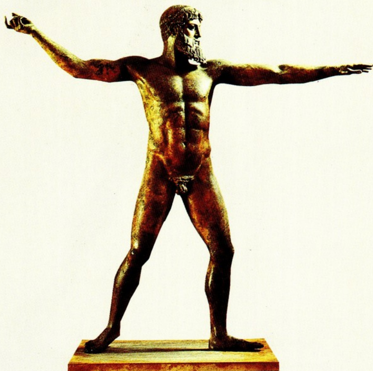
◀ 7. 普西頓 青銅 西元前 460-450

於古典時期所作的宙斯像，有著更大弧度的動作。首先可看到宙斯高舉的右手執著具體而完整的雷電，左手前伸，目視前方，似將顯神威。祂的前胸有著明顯的中軸線，讓軀幹在對稱式、平穩的結構中，肌理卻流露出繃緊的內在張力。此外宙斯的雙腿也出現了過去宙斯像所未有的形式。祂左脚前跨、右脚跟略離地，與雙手的動作，形成靜中將動的氣勢。