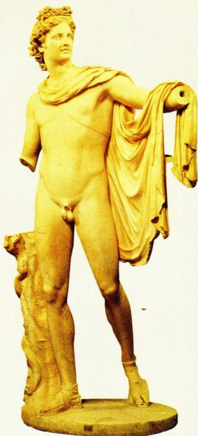
▲15.觀景殿的阿波羅像 大理石 原作於西元前四世紀 高 218 公分 此為羅馬時代仿製

阿波羅像的面孔一直是維持著一股俊秀的美感。此作除了那美麗的長髮外，其倚立的月桂樹則是其最大的象徵物。阿波羅那被理想化的人體比例、高翹的鎖骨、將重心集中於右腳所造成的動態變化，再加上其臉部神情，讓他在英挺中具有一股詩人的憂鬱。