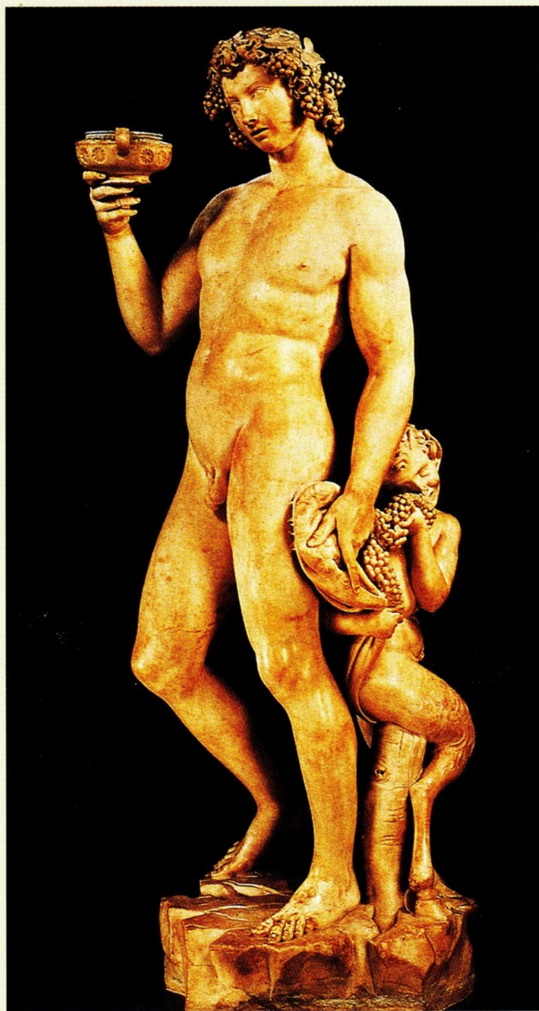
◀30.米開蘭基羅 巴可斯與幼年的潘恩像 大理石 西元前1497-1498 高203公分

文藝復興時的巴可斯，又回到神話裡的描述，米開蘭基羅讓祂像個剛成年的俊美少年，頭上戴著葡萄藤與果實的花冠，右手拿著淺酒碗，有若早期的阿波羅像右手拿著酒碗，撒地祭神的樣式。於此巴可斯的神情，有著醉意；祂的左手與小潘恩一起抓著獸皮，而潘恩尚且娛悅地啃食葡萄，並也帶有醉意。藝評家認為米開蘭基羅於此將古典主義的神話圖式，和其所崇敬的基督教結為一體，而以巴可斯象徵酒醉的諾亞。此外，米開蘭基羅也將其專精的解剖學、和肌肉功能等，藉此作發揮得淋漓盡緻。