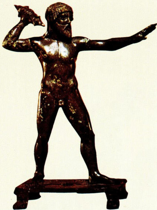
◀ 6. 宙斯像 青銅 西元前 460 多多尼出土

於古典時期所作的宙斯像，有著更大弧度的動作。首先可看到宙斯高舉的右手執著具體而完整的雷電，左手前伸，目視前方，似將顯神威。祂的前胸有著明顯的中軸線，讓軀幹在對稱式、平穩的結構中，肌理卻流露出繃緊的內在張力。此外宙斯的雙腿也出現了過去宙斯像所未有的形式。祂左脚前跨、右脚跟略離地，與雙手的動作，形成靜中將動的氣勢。