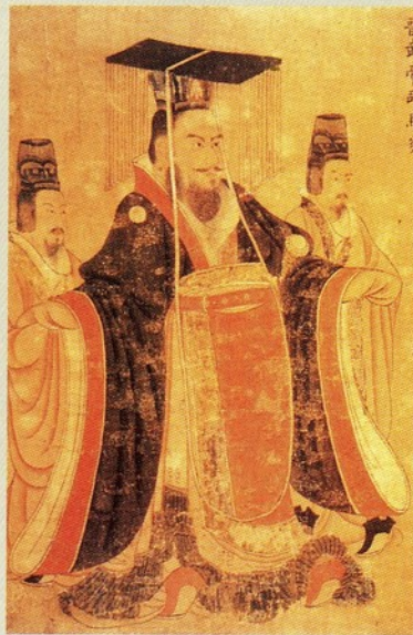
▲歷代帝王圖卷(部份) 唐(傳)闡立本

但冕服所關種種「文以載道」的精神涵義，非關本文的重點，其中有一部分在本文從略不敘。