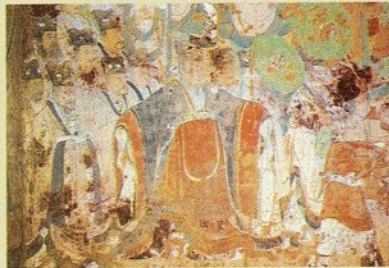
▲維摩詰經變（局部） 帝王與群臣 初唐 敦煌二二〇窟 東壁南側

「非帷裳，必殺之。」的殺字，在此讀音「賽」（尸旁、Shoi）的字義是剪縫。就是說，不是帷裳，就要剪縫，這是常服。若是「帷裳」，那是後四幅連接成一大塊，由後向前裹身；前三幅亦成塊，向後裹身；其形如帷，因名「帷裳」，這是禮服。前三幅是單數，象徵陽；後四幅，象徵陰。（注1）這種前三後四之制，正也是「順陰陽」的表徵。《禮記》〈禮運〉說：「孔子曰：我欲觀夏道，是故之宋，而不足徵也。吾得乾坤焉。」注：「得陰陽之書也。」觀此又可知：這也是儒家的服飾理念之一端。所謂「順陰陽、明教化」的意義，乃在凡事務求其正常存在和運行，不