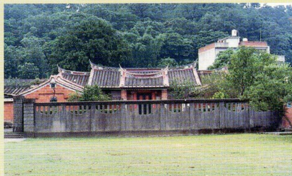
▲圖五：樂山（北埔姜宅：天水堂）