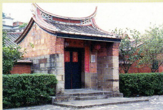
▲圖七：門屋（北埔姜宅）