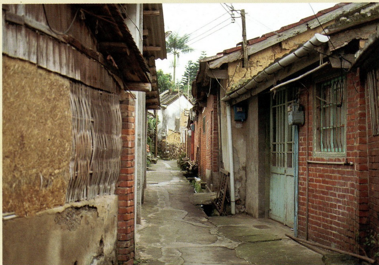
▲圖二：曲折的巷道可阻遏盜匪入侵