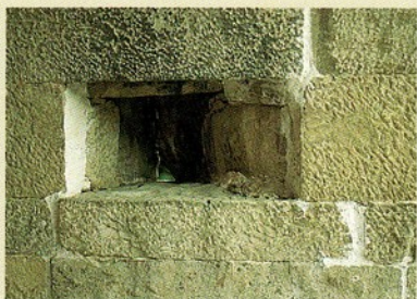
▲圖四：銃眼（外側已被堵塞）

當人類開始建造建築物時，就有了社交活動。對於居住空間的想像，以及聚集材料的技術，是新石器時代就有的成就，建築物的空間及安排方式，決定了居住人如何使用它，並在其中工作。建築物形成的方式，構成了人類的的生活方式，當然人類的生活需求，也影響了建築物的形式。