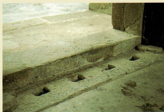
▲圖三：門背後的直立門、門孔