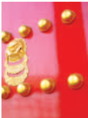
15 紫金城門修復後的朱紅大門

名、殿名的紅色燈籠，散發著層次分明的紅色光線，夜晚時分似是海岸燈塔的光線，指引著在人生苦海迷途的船隻返航似的，救苦救難不就是神明的職責嗎！錫製的桌燈、黑赭色塗漆的上下供桌，供桌上的祭祀用品，有鮮花、水果、餅乾，考驗神籤應允與否的紅色擲筊、紅綠黑色的籤桶，淡黃、藍、紅的籤詩整齊地排列掛在牆角，等候有緣人的取用。