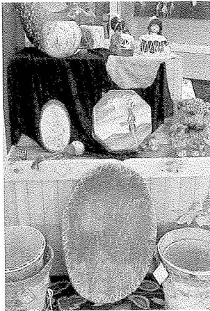
圖4 Bad River飯店賭場禮品店

要購自外州，例如「黑山」貿易公司，這些公司都聲稱其商品多半是原住民所創作。多數的禮品店經理都表示，銷售本地原住民所寄售的作品太複雜了，一位經理說，除非可以直接買斷，否則他們不再出售本地製作的產品；另一位當地的原住民經理，拒絕再展售任何當地製作的產品，但他們最初是只賣本地製作的產品。我去過的禮品店，都展售亞洲國家及中南美洲的產品，這些產品雖是遠從海外引進，但都與威斯康辛州特定的原住民遺產有關。許多本地的視覺文化原住民創作者，都被排除在這些禮品店之外，無法銷售他們的產品，的確很遺憾，當然原因也可能是他們不想要這樣的銷路。有少數人的作品出現在禮品店中，也創造了新的傳統形式，例如藤製的賓果籃，可以放些賓果遊戲的籌碼等小東西。還有的原住民創作一些紀念品，例如鑰匙圈、「捕夢網」等，賣給賭場遊客，這些禮品店甚至是全球「捕夢網」最主要的銷路。