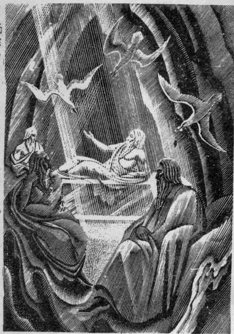
西徐亞神話中的插圖（木刻）域卜作

一個木刻家由於他的藝術教養的不同，藝術愛好的不同，生活環境的不同，以及他的作品的欣賞群眾的不同，經常決定着他的作品風格，但重視生活實踐，深入觀察，描繪對象時找取新的表現方式，並重視民族版畫遺產，從中學習廣大群眾所喜愛的藝術形式和藝術作風，也能形成新的風格。此外，以外國作品為借鑑，吸取其精華加以溶化，也是我國版畫創作新風格的途徑。 同時，個人新風格的建立都應受到鼓勵，但每種風格都應具有中國的作風和中國的氣派，這也就是所謂的民族形式。民族形式的問題，是藝術與廣大群眾之間密切聯繫的問題，同時也是對於國際藝術真正有所貢獻的問題。初學木刻的人，過早的要求建立自己的風格是不妥當的。因為作品的風格是在不斷創作過程中逐漸形成的，而且風格也是在經常發展變化的。 學習民族版畫和民族繪畫的遺產，建立新的，富有中國氣派的木刻風格和形式，不是看了一兩幅古代版畫或古代繪畫就可生效，而是要經過廣泛的瀏覽，長期的研究賞試之後才能有所收穫的。中國古代的複製木刻會有悠久的歷史，從唐到明有過卓越的成就，這方面的遺產是非常豐富的。此外漢代的石刻，也對於創造木刻的風格有參考價值。除此之外，中國民間的剪紙窗花也很有參考價值。在這民間固有的版畫，圖案和繪畫中，儘管風格有顯著的不同，但却是都有典型的民族形式。 末了，讓我們焚香禱祝，在木刻的祖國，年較的版畫藝術，在不久的將來，可以迎頭趕上。