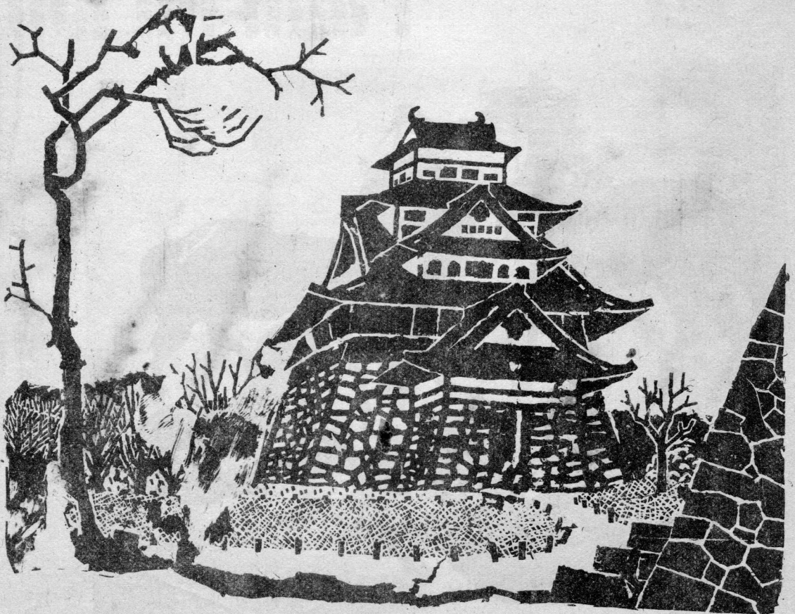
作一運塚平 (刻木) 城