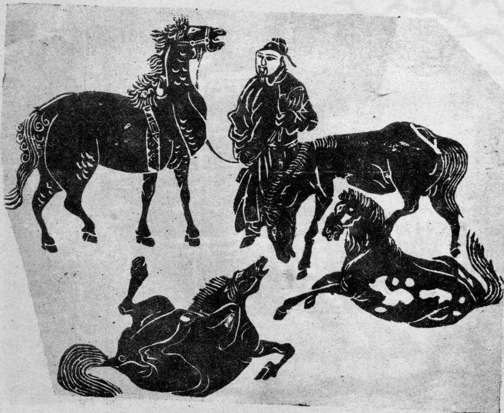
小憇（中國武梁時代木刻）

一個木刻家由於他的藝術教養的不同，藝術愛好的不同，生活環境的不同，以及他的作品的欣賞群眾的不同，經常決定着他的作品風格，但重視生活實踐，深入觀察，描繪對象時找取新的表現方式，並重視民族版畫遺產，從中學習廣大群眾所喜愛的藝術形式和藝術作風，也能形成新的風格。此外，以外國作品為借鑑，吸取其精華加以溶化，也是我國版畫創作新風格的途徑。 同時，個人新風格的建立都應受到鼓勵，但每種風格都應具有中國的作風和中國的氣派，這也就是所謂的民族形式。民族形式的問題，是藝術與廣大群眾之間密切聯繫的問題，同時也是對於國際藝術真正有所貢獻的問題。初學木刻的人，過早的要求建立自己的風格是不妥當的。因為作品的風格是在不斷創作過程中逐漸形成的，而且風格也是在經常發展變化的。 學習民族版畫和民族繪畫的遺產，建立新的，富有中國氣派的木刻風格和形式，不是看了一兩幅古代版畫或古代繪畫就可生效，而是要經過廣泛的瀏覽，長期的研究賞試之後才能有所收穫的。中國古代的複製木刻會有悠久的歷史，從唐到明有過卓越的成就，這方面的遺產是非常豐富的。此外漢代的石刻，也對於創造木刻的風格有參考價值。除此之外，中國民間的剪紙窗花也很有參考價值。在這民間固有的版畫，圖案和繪畫中，儘管風格有顯著的不同，但却是都有典型的民族形式。 末了，讓我們焚香禱祝，在木刻的祖國，年較的版畫藝術，在不久的將來，可以迎頭趕上。