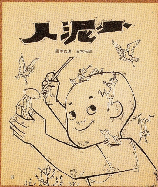
缺嘴魚·小泥人 文：張世音、邱松木 圖：洪義男 出版：洪建全教育文化基金會