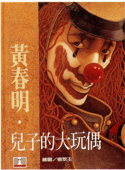
兒子的大玩偶 原著：黃春明 圖：楊翠玉 出版：台灣麥克公司