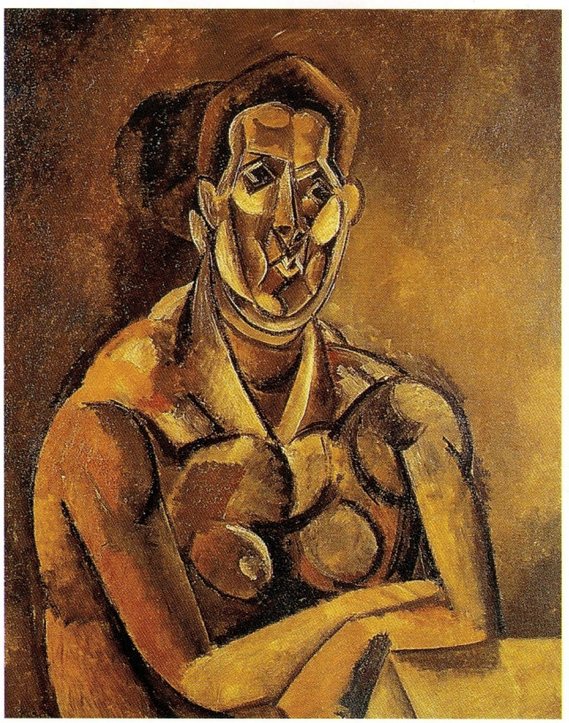
「女人(費南特)的半身像」(1909年)，左真是局部圖。