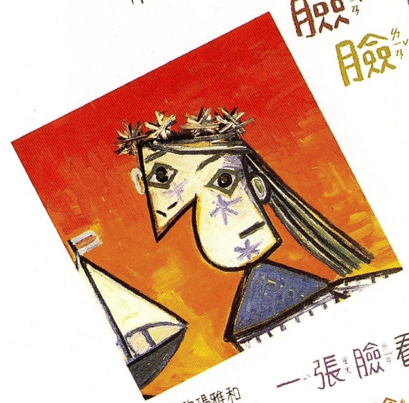
「戴花的瑪雅和玩具船」(1939年)