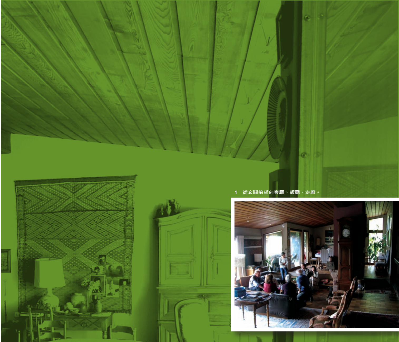
1 從玄關前望向客廳、飯廳、走廊。