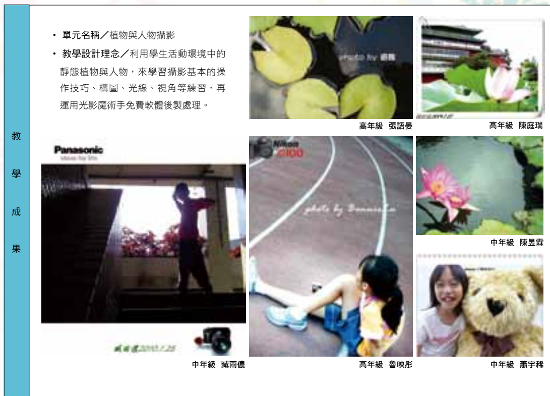
表 2-2 「植物與人物攝影」單元教學活動與成果分項表