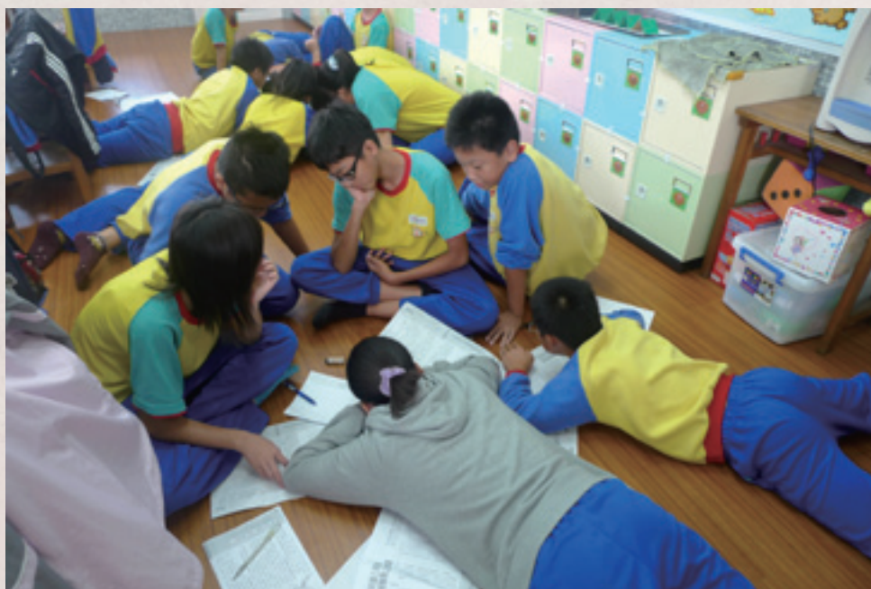
3 同學自發主動的參與，負起責任討論各組分工的工作內容，是戲劇創作不可少的過程。

發芽不知道，但孩子對責備的想法是有改變的，最大的收穫是孩子的互動更加緊密，而且他們學會解決問題，他們學會用正向方式去解決問題。真正的改變，從看戲的學生身上，我無法評估，但如果是實際參與戲劇演出的學生身上，他們的改變就很顯著。