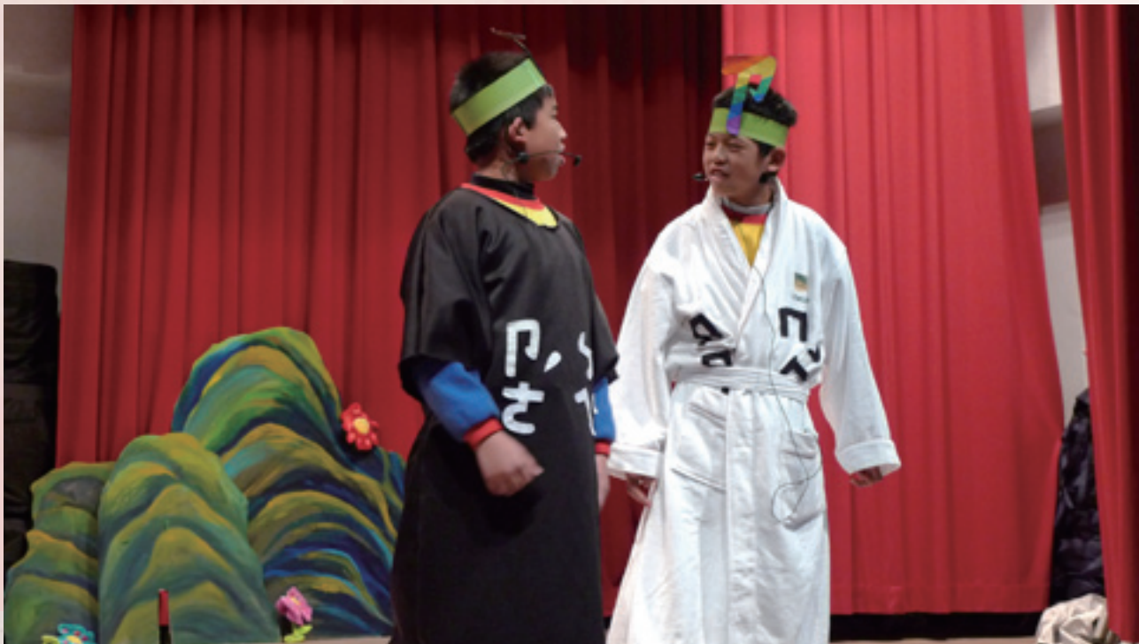
1 「讚美責備一家親」劇照，角色讚美與責備正在一較高下。

正面意味著一種建設性的態度，戲劇可以做為檢視我們人生信念的查核園地，而戲劇的呈現之地，即我們檢驗信念的實驗室，在此，我們在實驗室裡的查核便應該要嚴謹（rigourness），接下來的問題是哪些信念是值得讓我們檢驗的？這是我們該思考的問題。