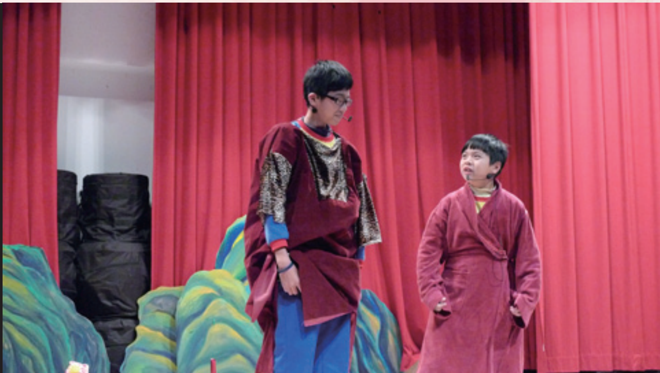
2 「讚美責備一家親」劇照，劇中晏子告訴車夫：「態度決定一個人的高度！」。

他們終究要面對親人或寵物離開自己，他們必須了解生命延續的意義；他的喜劇作品《安卓克里斯與獅子》（ Androcles and the Lion ），以義大利藝術喜劇（ commedia dell'arte ）形式，談論自由的真諦，同時介紹戲劇史上的一種劇種風格給兒童觀眾，他曾說過他把兒童當成年輕觀眾，是一個獨立個體。所以在他的戲劇中不會有假裝年輕的表演，因為兒童沒有成人的背景與經驗，所以劇作家的責任是「將兒童觀眾，在一種較高層次的狀態，引領進入假裝的世界」 3 。他深知戲劇對孩子的影響是一輩子的，所以，他總是慎選主題與承載的想法。