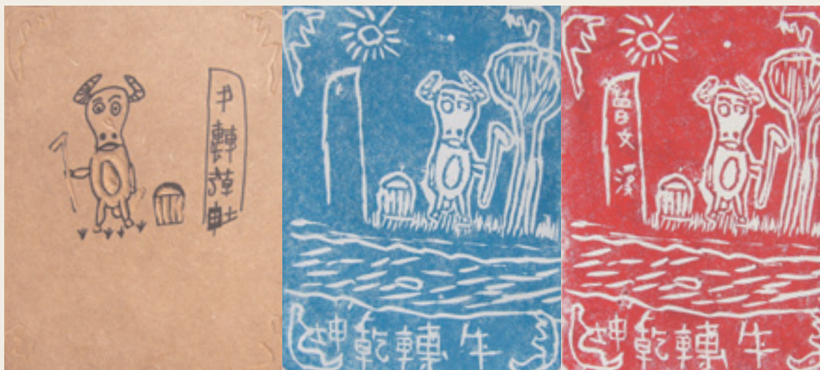
13 學生作品三階段創作過程

製作策略概念化，避開舊有的學科本位結構，以根莖般擴展方式引導學生難探究傳統藝術的「藝術性」與「特殊性」之際，亦能顧及「時代性」。