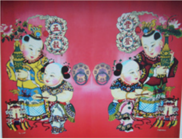
3 吉慶祥瑞題材

年畫多出自民間藝人之手，所以最能反映人民的心境和願望；幾乎所有的年畫都喻含著特定或吉祥的涵義，常能一目了然，直觀上常能給人舒適的快感。如畫面呈現白白胖胖的娃娃抱著一條活蹦亂跳的大鯉魚，就象徵來年生個頭好壯壯的小孩，而且吉慶有餘（餘和魚諧音）；如果是隻昂首長鳴的大公雞，就象徵來年人丁興旺（吉和雞諧音）；如果畫面是一個牧童和一頭大春牛，就象徵來年風調雨順，宜於耕作，五穀豐登；如果畫中有位騎鹿伴鶴的壽星老人，象徵壽、祿（祿和鹿諧音）齊賀（鶴和賀諧音）；如果畫面上出現搖錢樹和聚寶盆，就希望新的一年能招財進寶。此外，還有風景畫、花鳥畫，都寓有吉祥如意、人壽年豐的美意（整理自黎瑩，1990）。因此，色彩繽紛、寓意深遠的年畫，增添了農曆春節不少的喜慶氣氛。