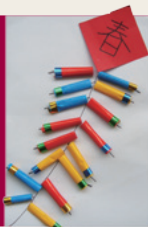
5 學生作品