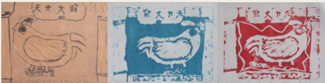
11 學生作品三階段創作過程