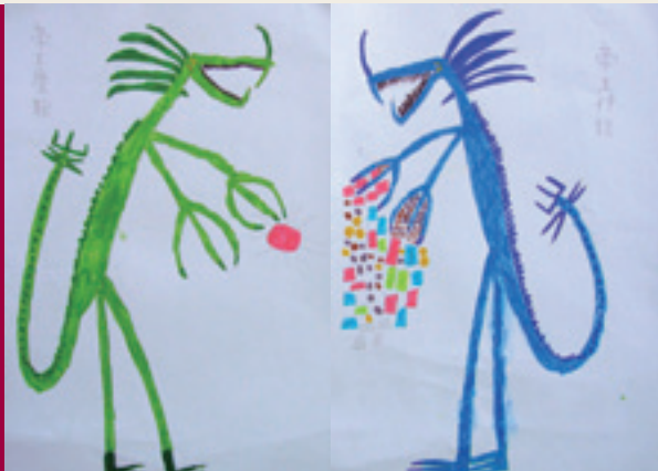
8 學生作品

鈞加：因為（我電腦遊戲等級練得很慢），所以（請他來幫我練等級），現代化的他配備著（滑鼠、鍵盤），可以（幫我破關）。