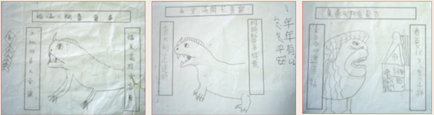
7 學生創作 — 年獸、春聯與鞭炮的組合