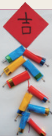
6 學生作品