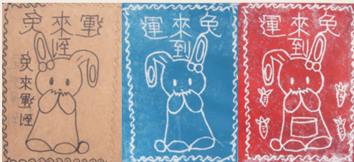
12 學生作品三階段創作過程