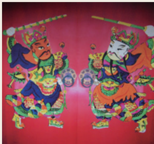
1 武將門神

門神有武將和文官兩種，武將門神如秦叔寶與尉遲恭或是神荼與鬱壘（如圖1），常置於大門上鎮守家宅，文官門神亦稱祈福門神（如圖2），有加官、進祿、富貴、進爵，門神畫布置在住家大門上，反映對幸福美好生活的追求。