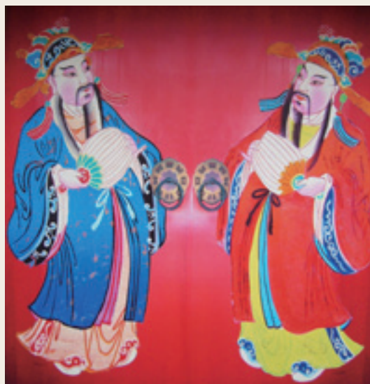
2 文官門神