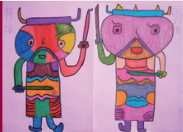
9 學生作品