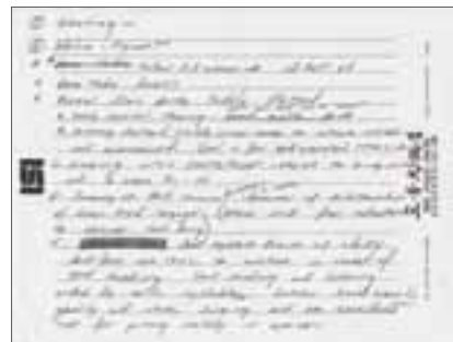
5 Diane 利用旅館裡面的信紙編寫教案