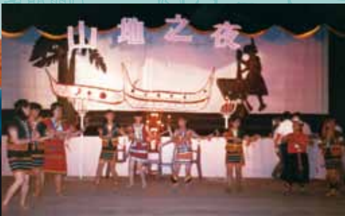
11 山地之夜。