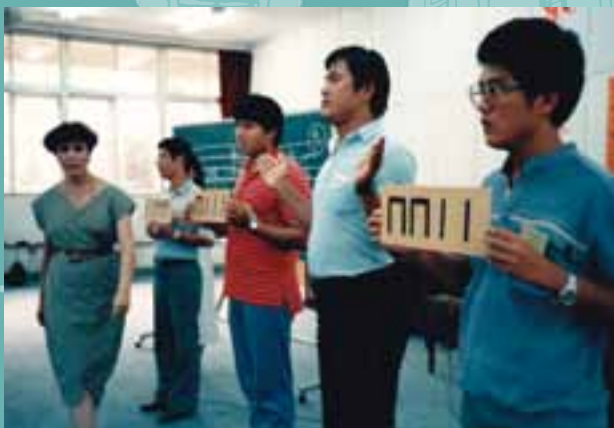
10 節奏教學。