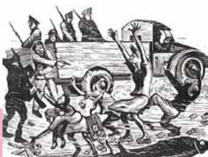
3 黃榮燦 恐怖的檢查 1947 木刻版畫

第二階段的台灣人權發展，直到 1987 年戒嚴法解除後，才如雨後春筍般的蓬勃發展。換句話