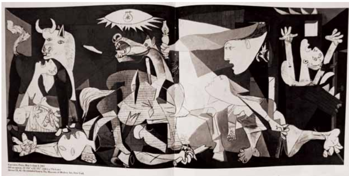
1 畢卡索 格爾尼卡 1937 油彩 351×782cm

畢卡索透過這幅畫，批判西班牙佛朗哥發動內戰的反人道作為，此作讓他贏得二十世紀「反戰畫家」的榮耀。