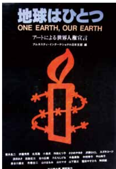
2 《我們唯一的地球 ONE EARTH, OUR EARTH 藝術家的世界人權宣言》封面圖